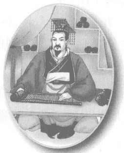
周朝时它是天子的专用品