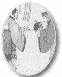
春秋后期由王室史官献给诸侯