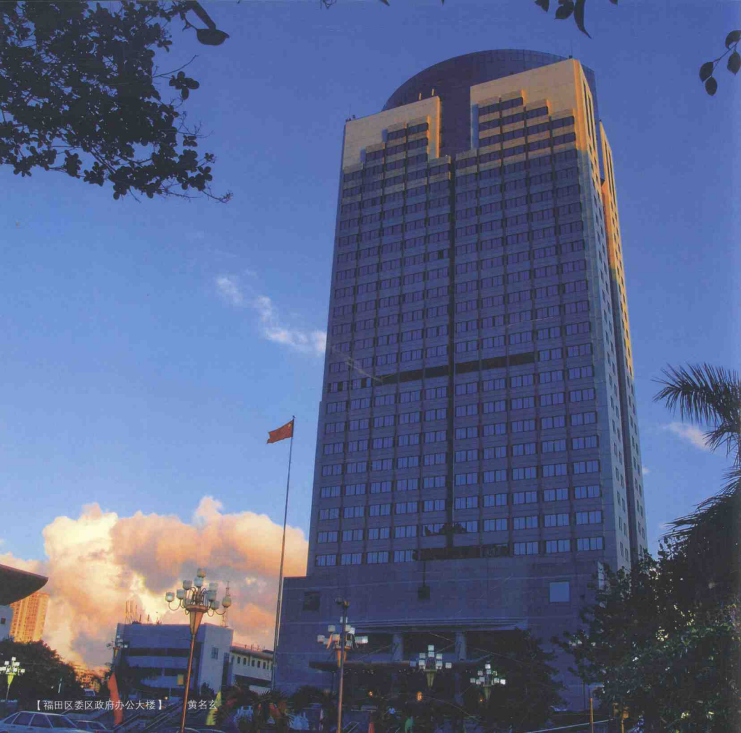
【福田区委区政府办公大楼】 黄名玄