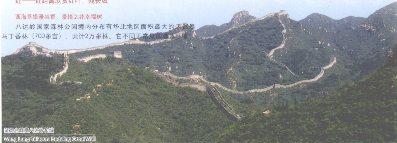
望龙台瞰眺八达岭长城 Wang Lung-Tai tours Badaling Great Wall