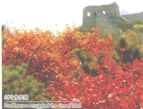
红叶依长城 Red leaves snuggled the Great Wall

北京八达岭国家森林公园位于万里长城八达岭和居庸关之间，总面积4.4万亩，最高峰海拔1238米，分布植物539种、动物158种、林木绿化率达到96%，为中国首家通过FSC国际认证的生态公益林区。公园主要景区有红叶岭风景区、青龙谷风景区、丁香谷风景区。