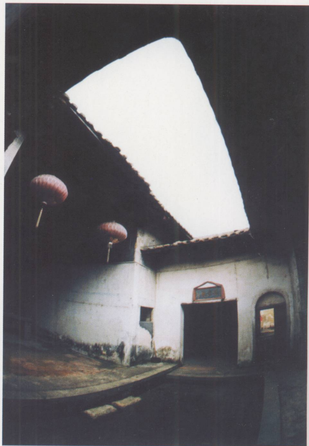
天井，是客家民居特有的建筑结构，用于透光、通风。