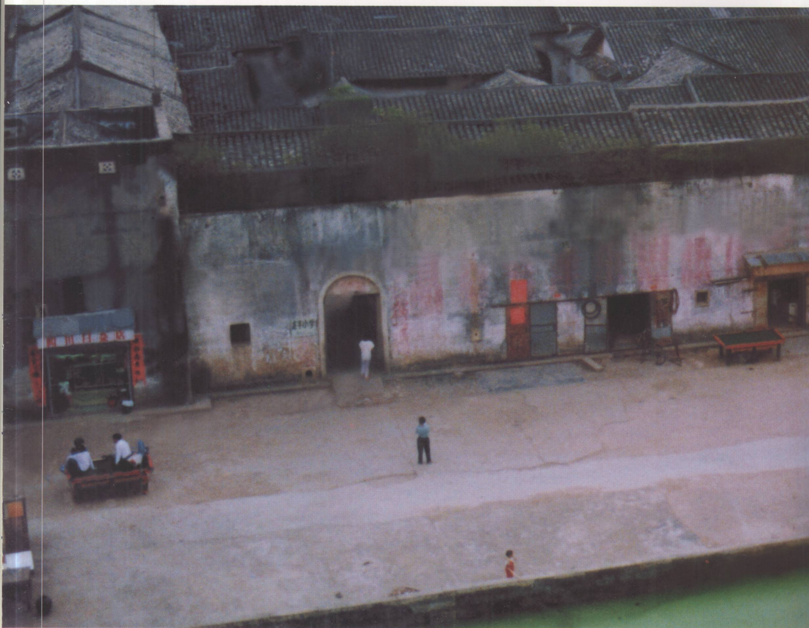
鹤湖新居是深圳市最大的客家屋围，被列入深圳市文物保护单位。