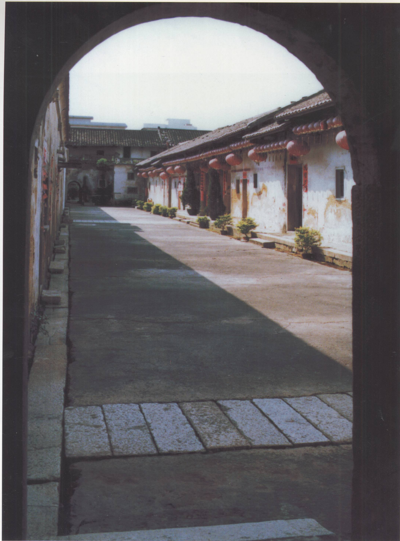
这是鹤湖新居一进侧门，透过侧门，可见宽敞整齐的街坪和中栋一角。