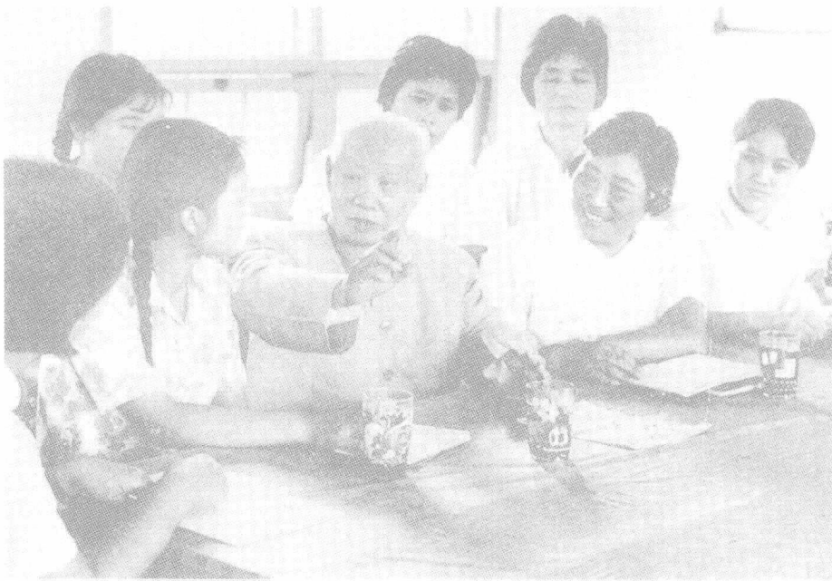
陈鹤琴 1977 年与南京鼓楼幼儿园教师们研究教学工作。