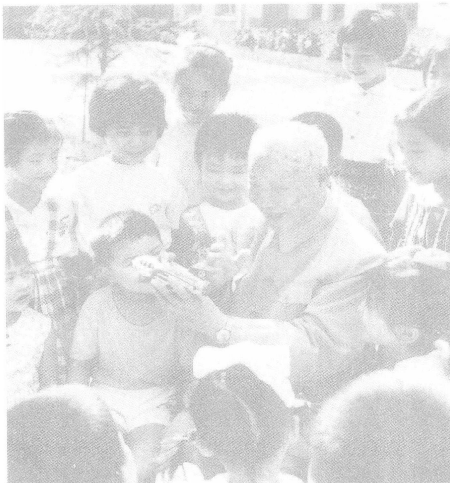
陈鹤琴 1977 年在南京鼓楼幼儿园给小朋友讲故事。