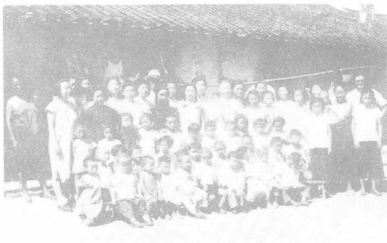
陈鹤琴(后排中)1947 年 8 月在上海大场托儿所与幼专、幼师同学和托儿所小朋友合影。