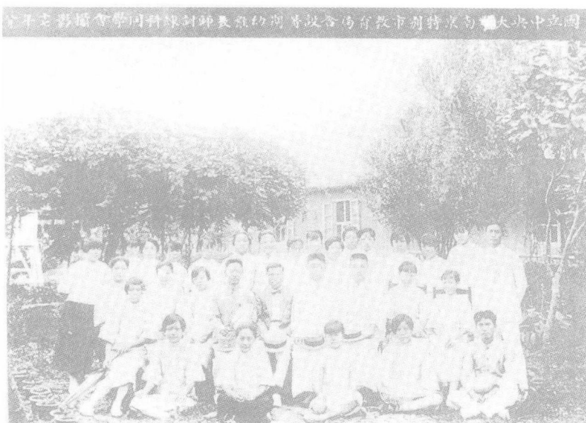
陈鹤琴(二排右六)1928年8月与国立中央大学、南京市教育局合设暑期幼稚教师训练科同学合影。