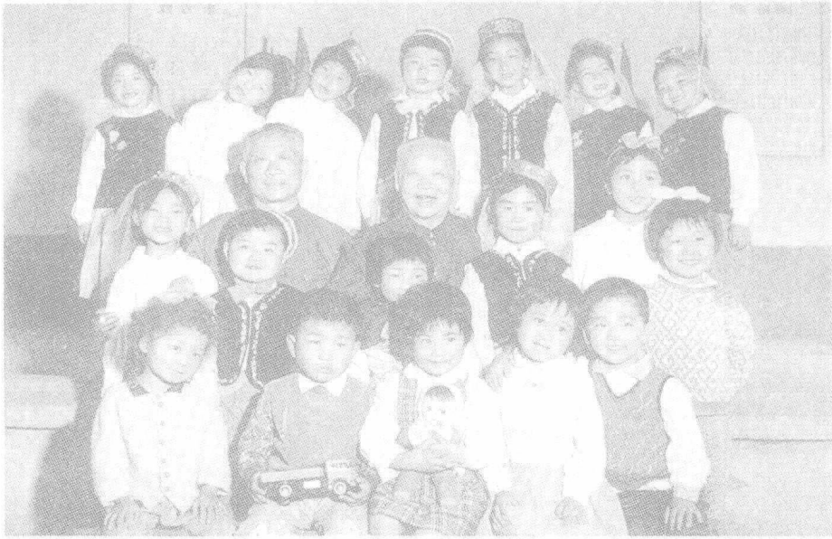
陈鹤琴 1978 年与南京鼓楼幼儿园小朋友欢度六一儿童节。（左为陈鹤琴长子一鸣）