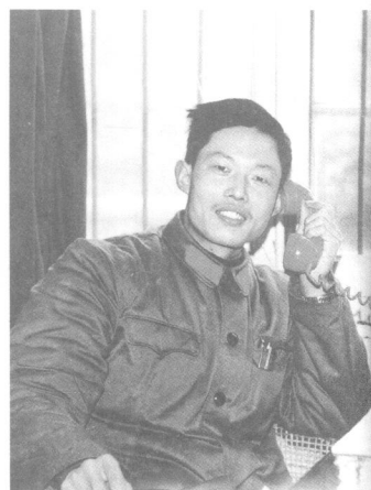
1976 年与战友登上伏牛山之颠 1983 年值班