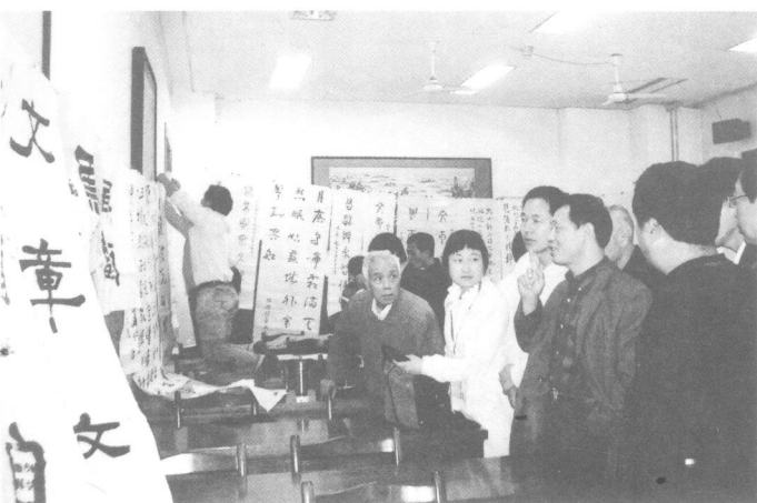
2008 年在总后书法培训班讲课点评作品