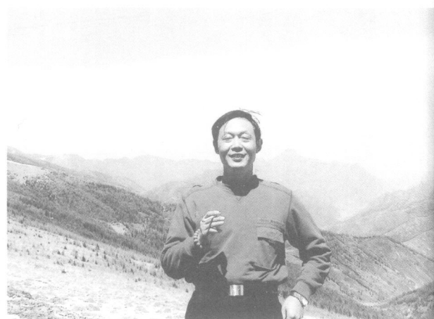
2008 年参加中国书协书法进万家活动，在五台山顶小憩