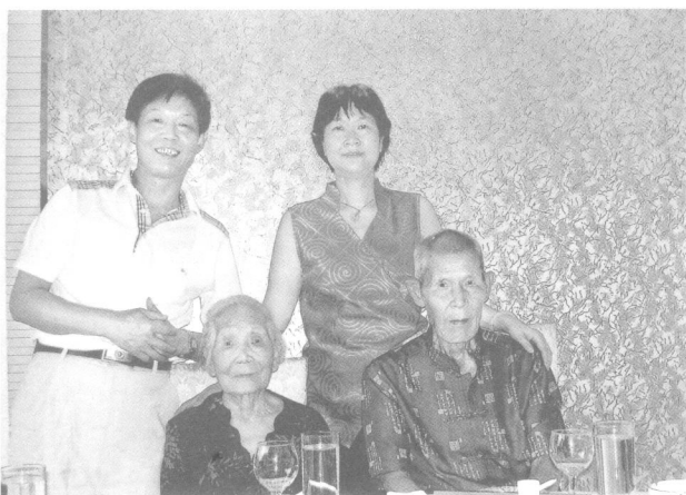
2007 年父母 90 寿辰纪念