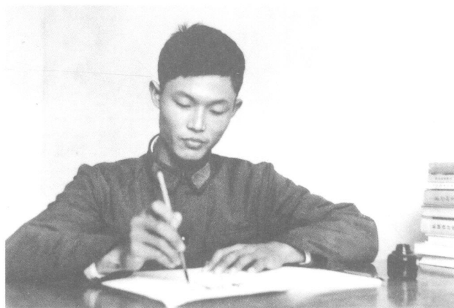
1974 年新兵训练之余练习小楷