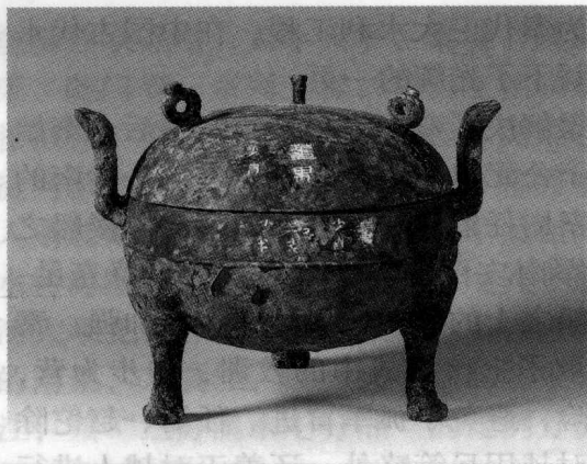
南越王墓出土“番禺”铜鼎（通高 21 厘米，腹径 21.5 厘米）

丞□□□”12字。考古学家推断为秦王政十四年（公元前232年）之物。铜戈的主人应该是秦统一六国后南征百越的将士。这件铜戈是秦始皇统一岭南的历史物证。1952年底在广州西村石头岗发现一座秦墓，出土的陶器全属南越式，有瓮、罐、三足罐、三足盒、甗等13件，铜器20件，还有大玉璧、玉印和玉带钩各1件。墓中出土1件椭圆长形漆奁，长28厘米，上有“番禺”两字烙印。“番禺”即“番禺”，是秦汉时南海郡的郡治。这是“番禺”地名见于考古实物最早的一例。