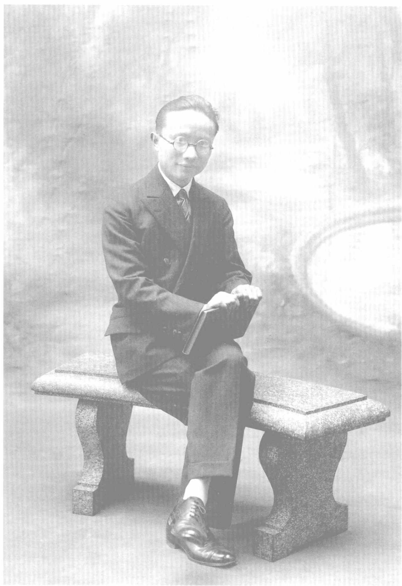
1929~1933年在法国斯特拉斯堡大学攻读博士学位的朱光潜