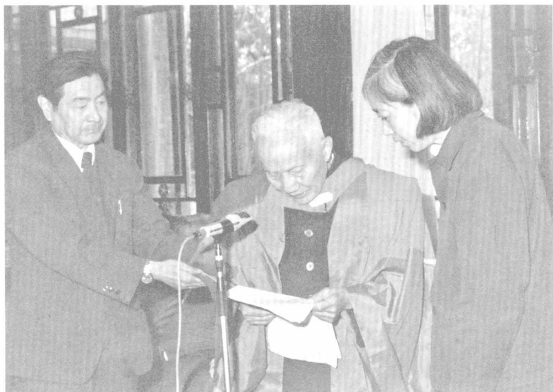
1980年，朱光潜获香港中文大学名誉博士学位。