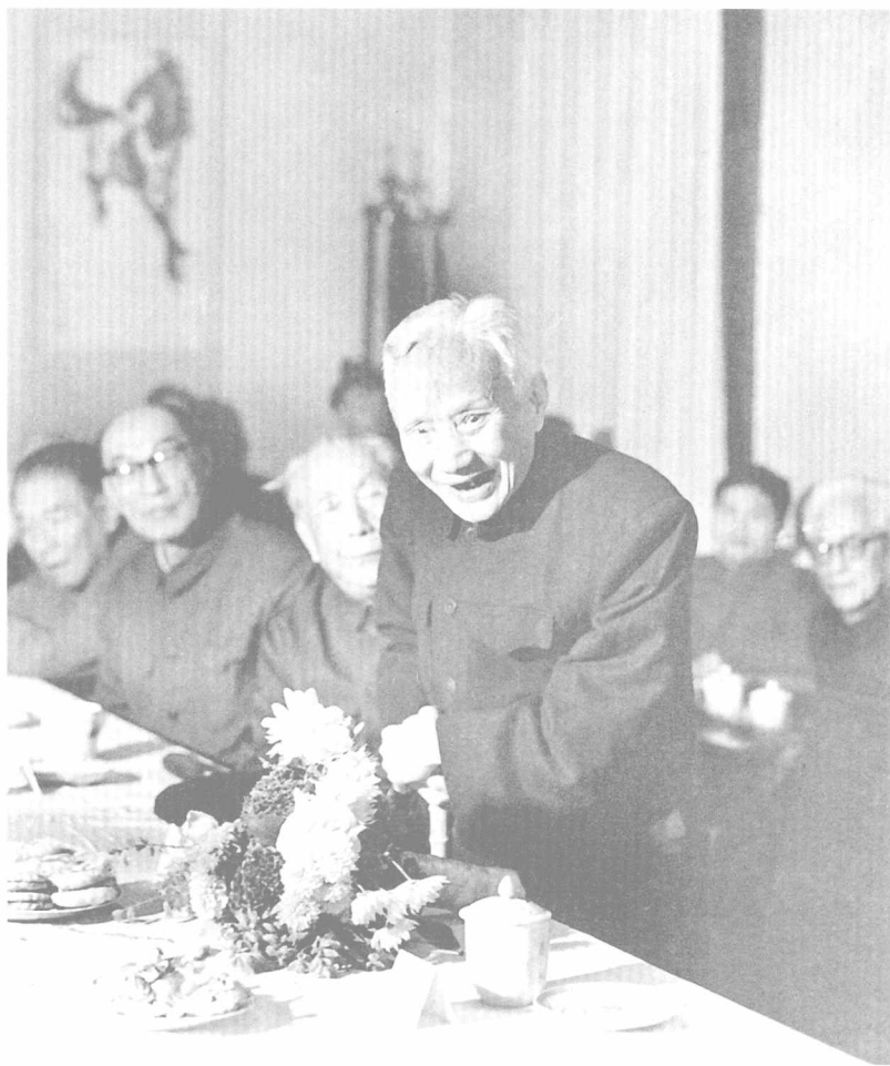
朱光潜执教60周年纪念会（1983年）