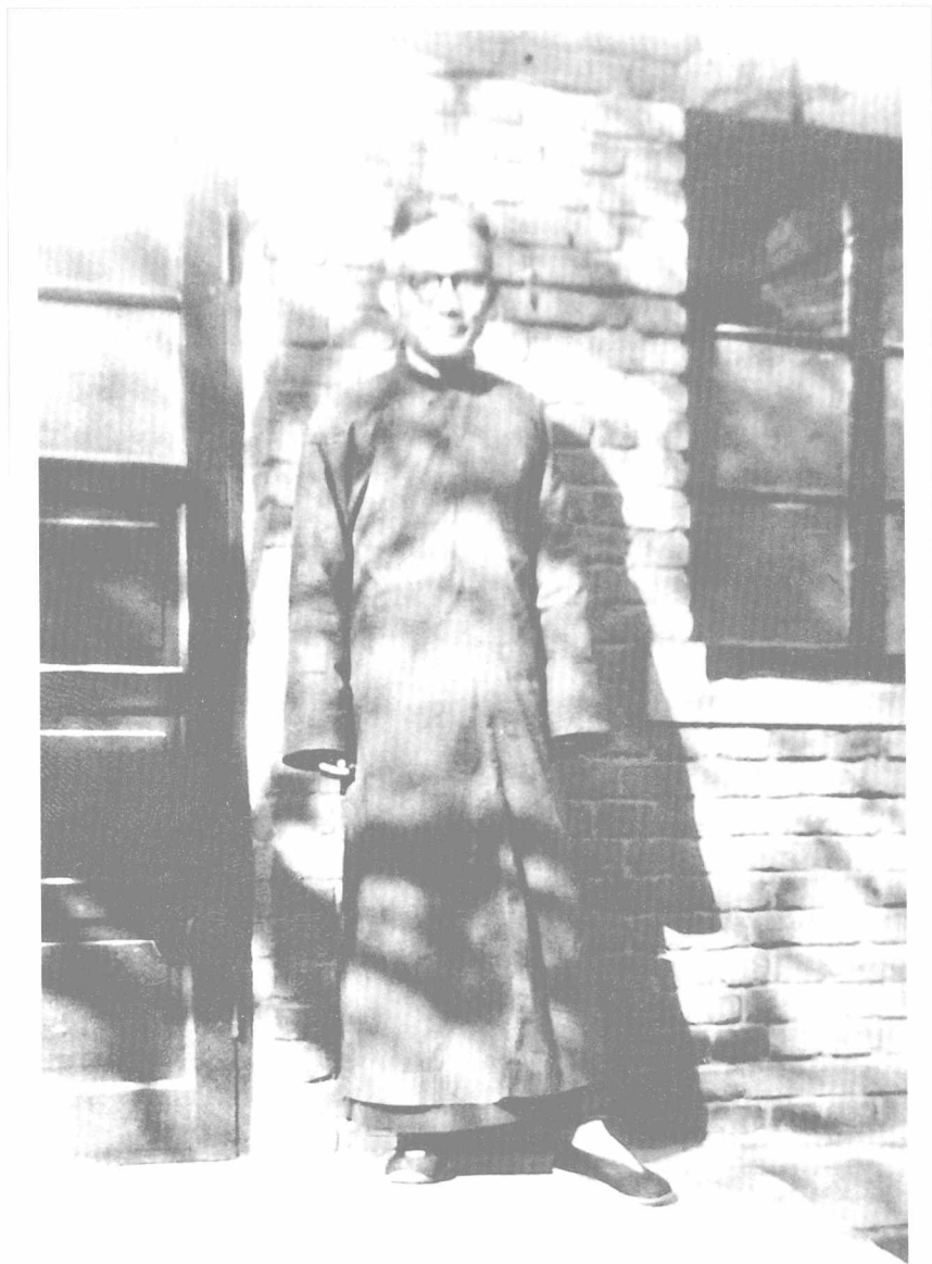
1946年抗战胜利后，朱光潜返回北大任教。