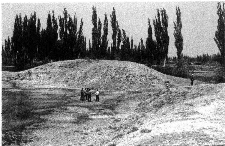
新和屯田遗址玉奇喀特故城

西汉初期,由于长期战乱,国力较弱。在蒙古高原游牧的匈奴统治阶级,为了掠夺更多的奴隶和财物,经常派骑兵攻掠西汉北部边境,烧杀抢掠,大肆破坏,给西汉北部边境人民造成深重的灾难。