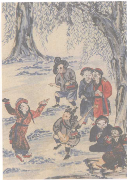
清《云南种人图说》所绘彝族