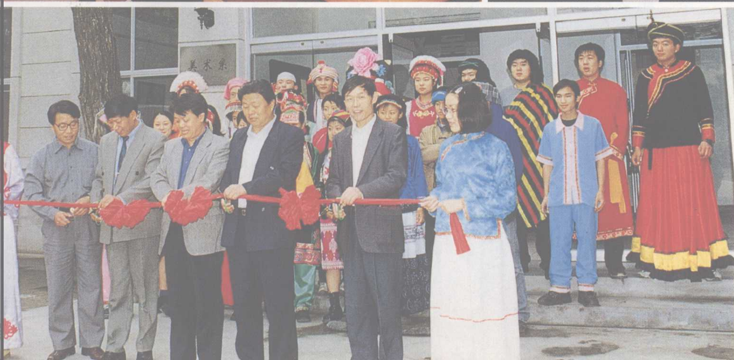
◀ 美術系師生迎國慶五 十週年畫展開幕剪綵