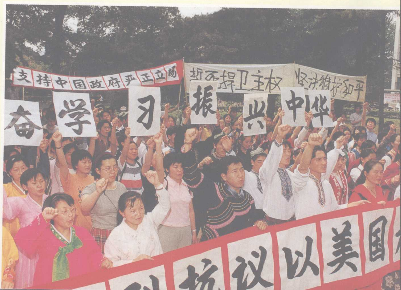
▶ 满腔义愤斥北约 奋发学习强祖国