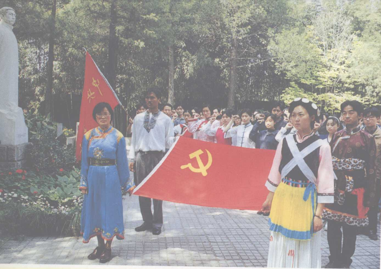
◀ 新党员在李大钊墓前进行 入党宣誓