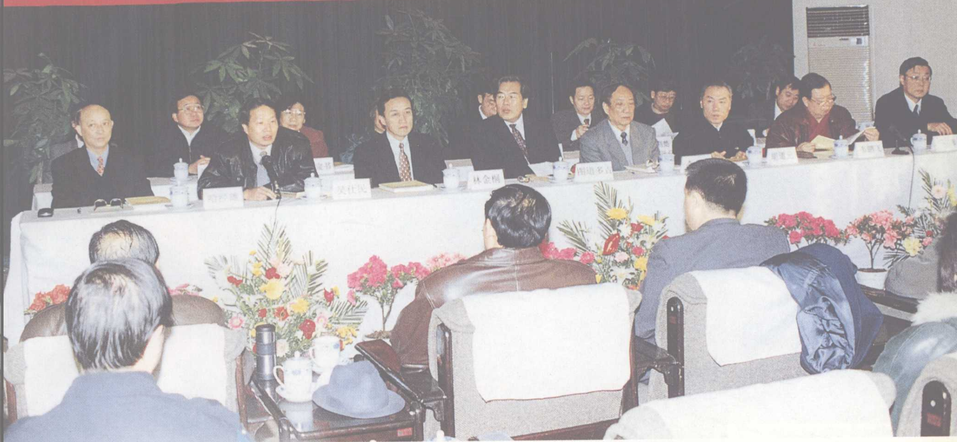
我校通过“211工程”立项审核