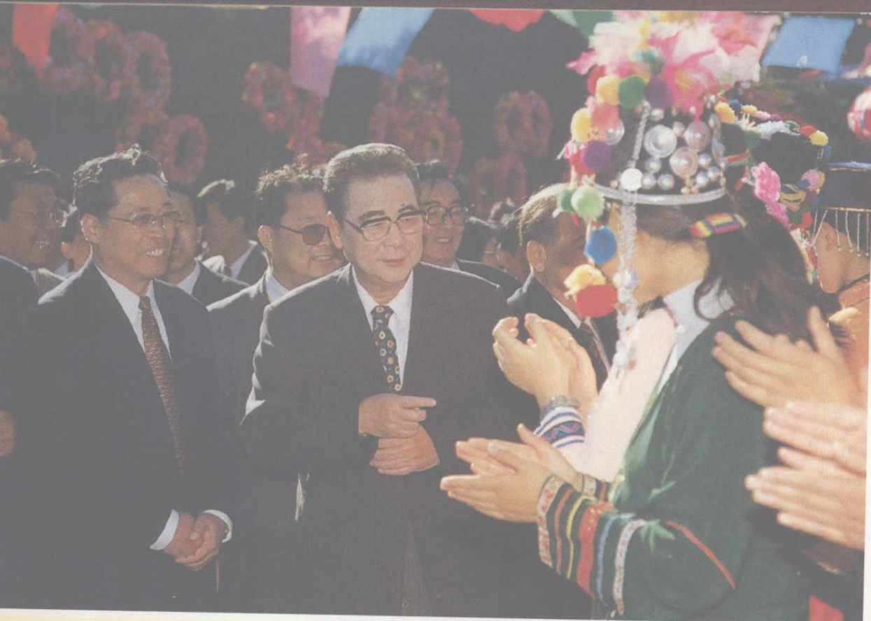
◀ 国庆五十周年李鹏委员 长在中山公园和我校少数 民族大学生在一起