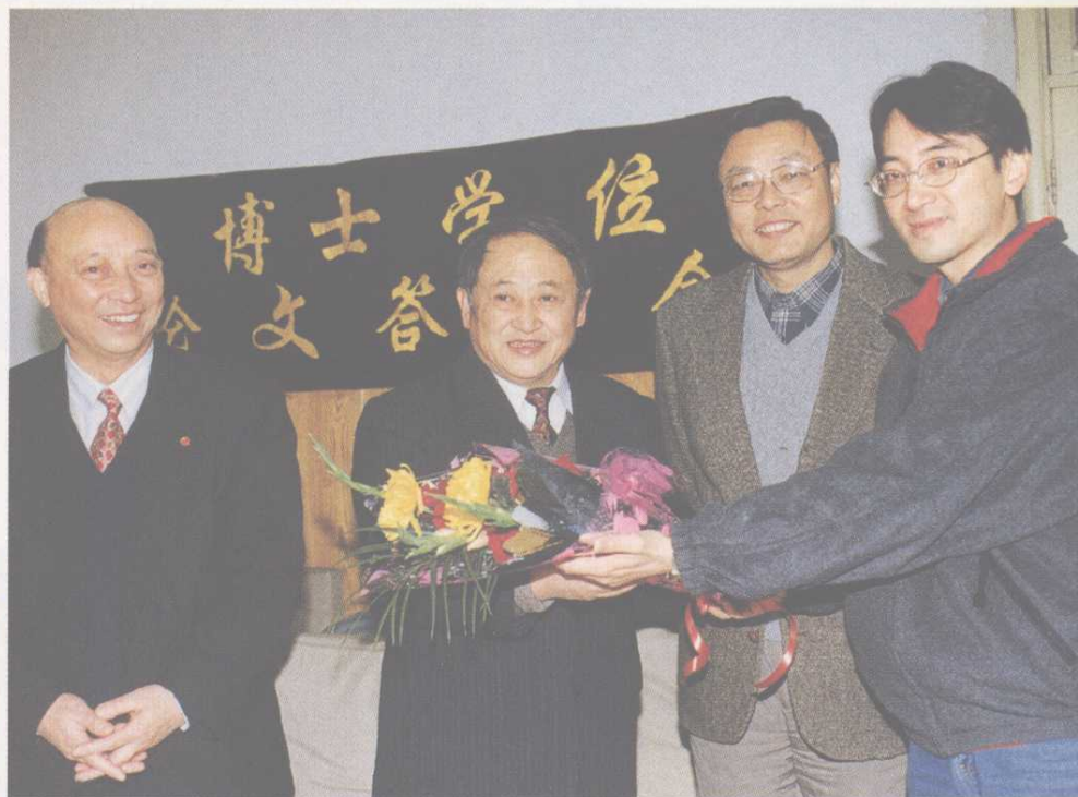
▲ 澳門首位在國內攻讀 博士學位的研究生在我 校通過論文答辯