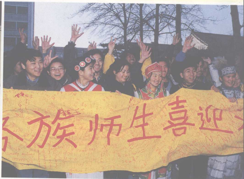
▲ 各族师生喜迎澳门回归