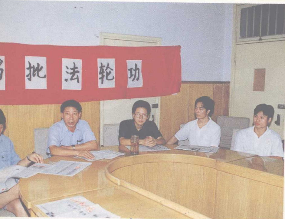
▲ 我校师生深入揭批法轮功