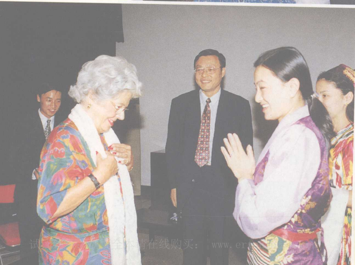
◀ 英国下议院议长贝蒂女 士来校访问