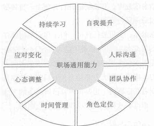
图 1-2 8 种职场通用能力

在这 8 种能力之中，人际沟通能力最为重要。人是群体性动物，个体不可能不与他人交往，在一个组织中更是如此。所以，每位职场人士平时都需要积极改善人际关系，要加强与上级、同事及下属的沟通。尤其是在压力过大时要主动寻求他人帮助，也可通过与家人、朋友交流等方式来积极应对。