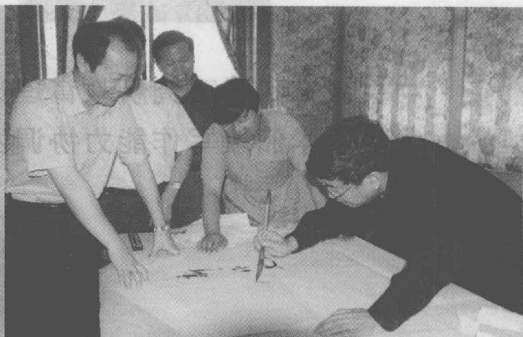
著名学者余秋雨为“新作文”题字