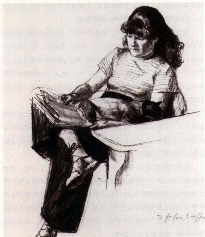
爱德华·霍珀 艺术家的妻子 1935—1940年