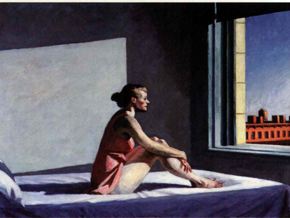
爱德华·霍珀 早晨的太阳 布面油画 1952年 71.4cm×101.9cm