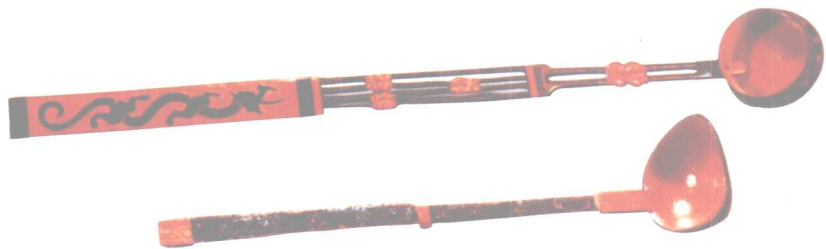
▲ 竹胎浮雕龙纹漆勺