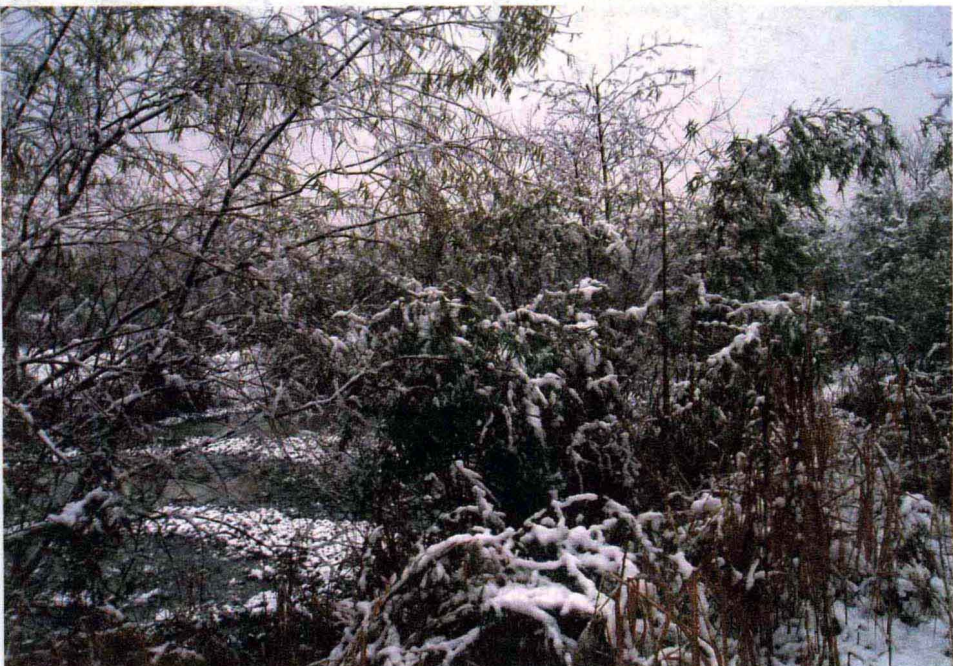
西溪湿地

例严谨，文字精练，考订审慎，引文均注明详细出处，论说深思熟虑。其对先秦货币之断代等问题有独到见解，于后世钱币学之研究影响甚大。洪皓的《松漠纪闻》和洪迈的《容斋随笔》等书均为综合性相当高的杂史，考订至审、议论精当，具有“新、奇、异”的特点，开创了一种新的史学体例。这种新的史学体例具有多学科综合、多视角观照、强烈的时代感和经世致用等优点。其中《容斋随笔》引证详洽而多所辨订，非徒事倚摭者比，是宋代以考辨为主而杂采琐事类笔记的代表作。其考据之精核堪与沈括之《梦溪笔谈》等相比。《四库全书总目》提要称其“自为精博，南宋说部终当以此为首”。在人才问题上，洪皓父子也非常求实。他们都十分重视人才、爱护人才，在朝廷或地方为官时推举选拔了許多人。但对科举制度以利诱人的流弊深以为忧，给予尖锐批判。淳熙十四年（1187）春，洪迈差知贡举，考试后即对当时的选举办法提出改革建议：“举子左掠右取，不过采诸传记杂说，以为场屋之务……臣等虽择其甚者斥去不收，而满场多然，拘于取人定数，不可胜黜。间有文理优长者，置在高选者，亦免有此疵病。乞以此章下国子监并诸州学官，揭示士人，使之自今以往，一洗前弊，专读经书史子。” 1 洪迈忧虑的问题至今我们仍然面对。