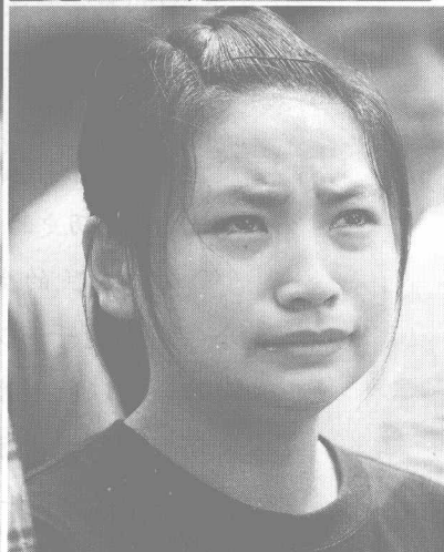
四川受灾民众的悲怆表情，撞击着全国人民的心灵。