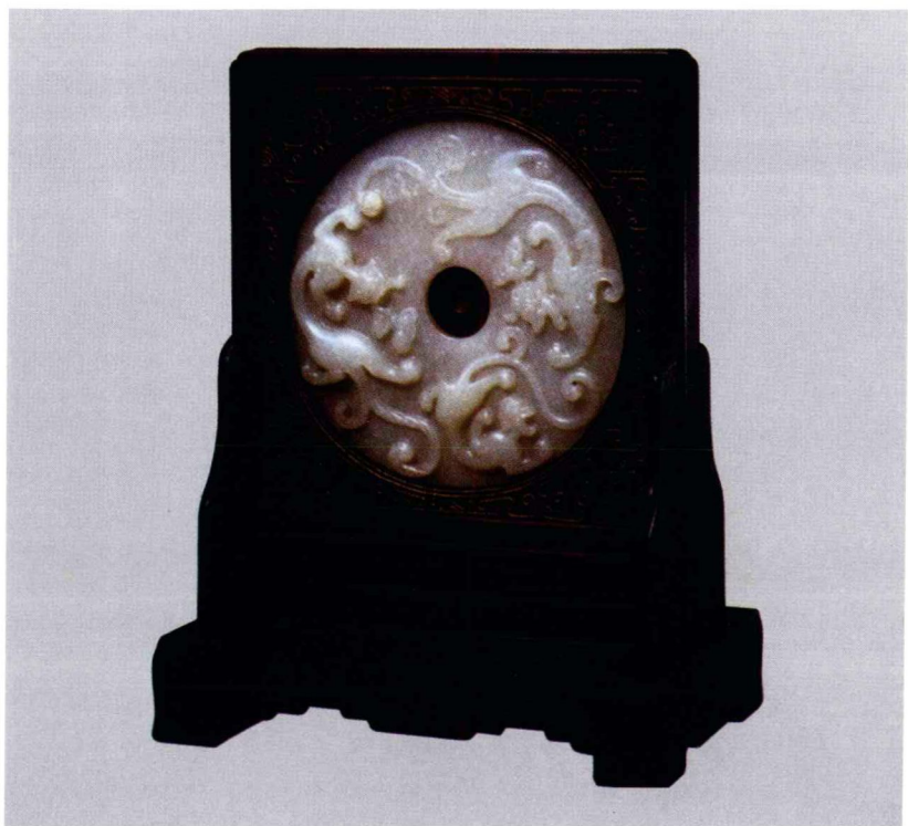
清 紫檀嵌玉璧插屏

藏品特征：这一组木雕屏风，由五块组成。中间主屏风高172厘米，宽67厘米。两边的四块高度分别是164厘米、156厘米，宽34.5厘米。主屏风的中部雕刻有福禄寿、济公、八