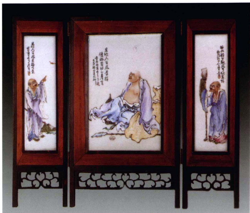
民国 硬木粉彩屏风