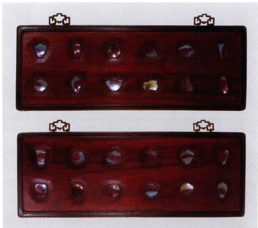
清 硬木嵌钧瓷挂屏

京、河北、山西、陕西、河南、山东、江苏、安徽、上海、浙江、江西、福建、广东、台湾、香港等地的收藏家和古玩商也都把古典屏风作为投资或经营的重要对象，出现了大量老屏风由偏远地区向繁华地区转移、由小城镇向大都市集中的局面。