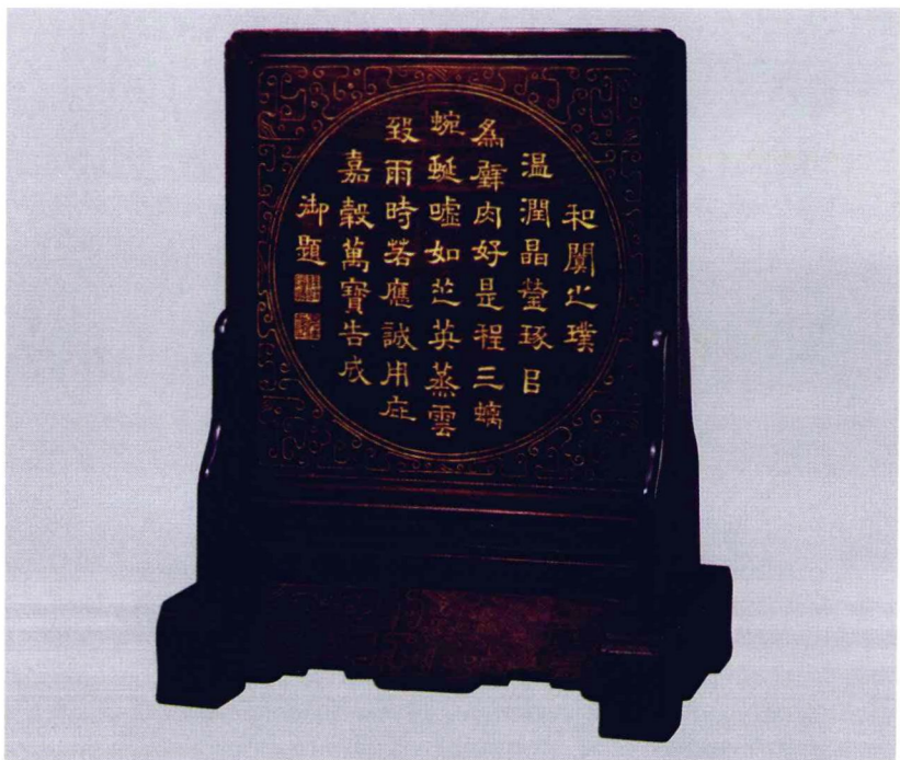
清 紫檀嵌玉壁插屏（屏背）

仙以及松鹤图案等等，底部雕刻的是双龙戏珠。另外四块上分别雕刻的是民间民俗生活情景和象征吉祥的花纹图案。屏风后边的边框上刻有“光绪丁酉仲夏陶氏宗祠”。