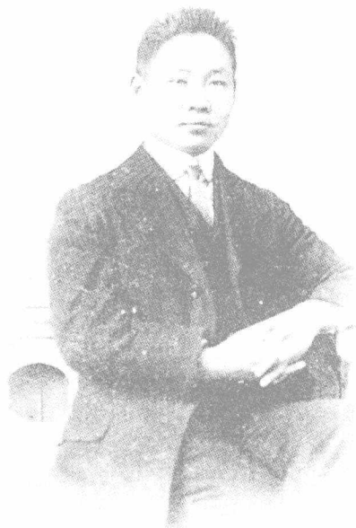
1916年,陈鹤琴在美国霍普金斯大学学习时摄。