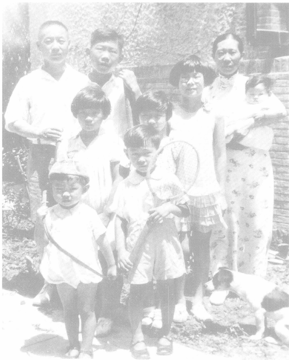
1935年，陈鹤琴和夫人及子女在上海寓所。