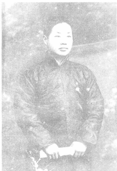
1912年,陈鹤琴在北京清华学堂学习时摄。