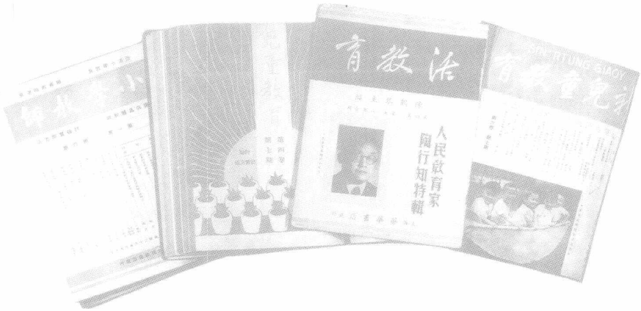
陈鹤琴的部分著作和主编的刊物。