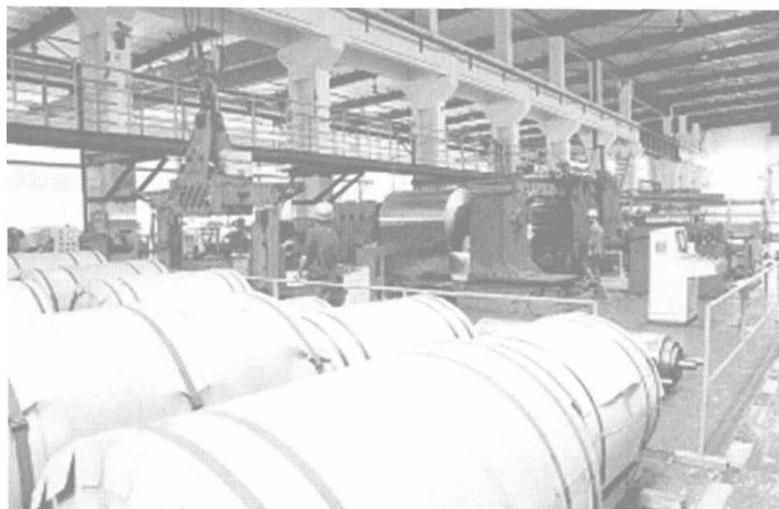
南宁市“工业强市”战略已显成效

转移，吸引内外资企业落户发展，建设特色园区，发展园区经济，推进工业发展重心向园区集聚，到2010年，工业产值超100亿元的工业园区达3个以上。加快构建促进工业发展的支撑体系，建立完善投融资支撑体系、政策支撑体系、创新支撑体系和产业配套支撑体系，加大对重点产业、重点企业、重点项目、重点园区的支持力度，完善融资担保、技改贴息、争创品牌、技术创新、节能降耗、企业上市等扶持政策。