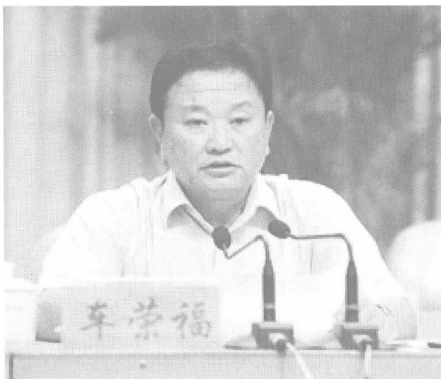
图为广西壮族自治区党委常委、南宁市委书记车荣福

改革开放以来，南宁市从一个南方的边陲城市变成了一座天下民歌最眷恋的城市，一座风情无限的魅力之城，一座面向世界、拥抱东盟的开放之城，一座物质文明、政治文明与精神文明建设协调发展，经济和社会各项事业全面进步的全国文明城市。