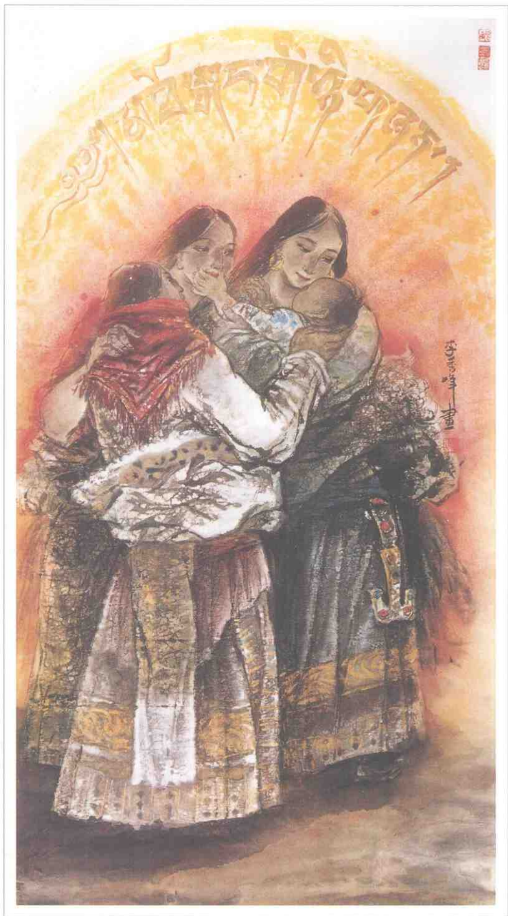
● 高原太阳 ● The Sun on the Plateau