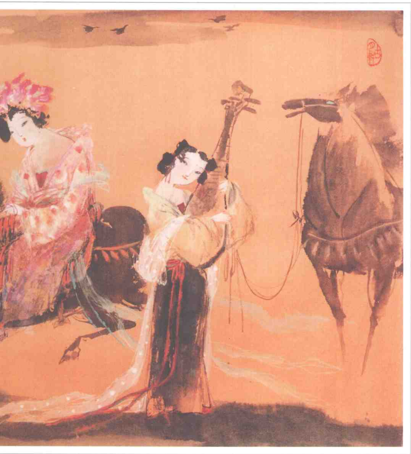
● 莫道春度芳菲尽，别有风情数落红 ● Beautiful Scenery in Late Spring