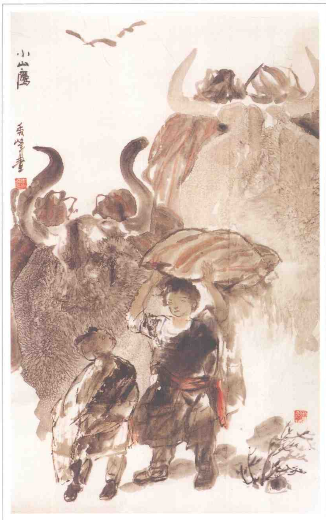
● 小山鷹 ● Eagle