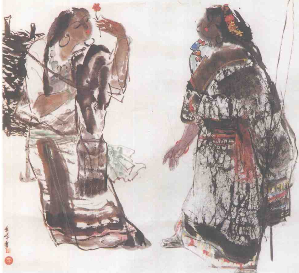
● 賞花圖 ● Watching Flowers