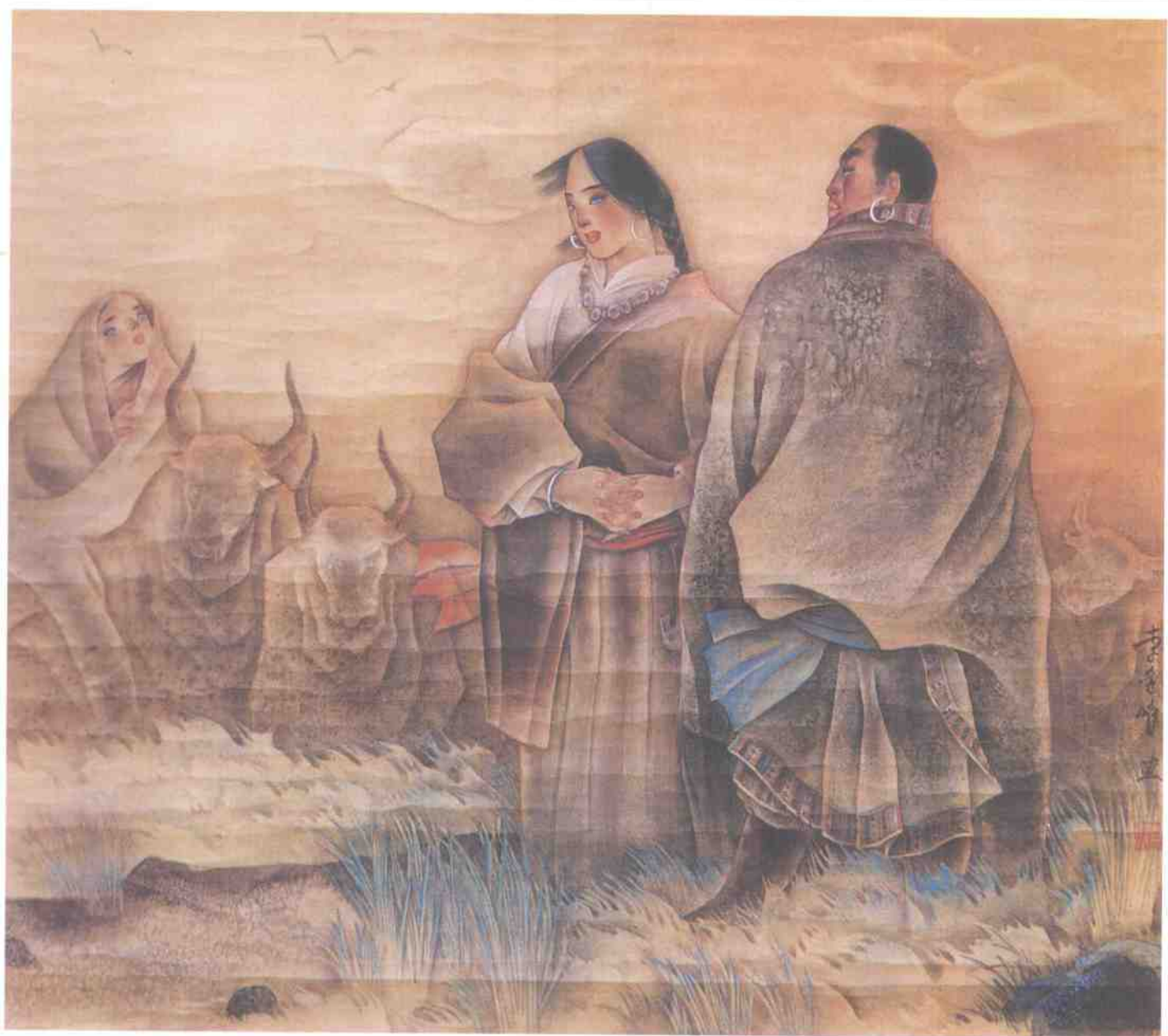
● 这一方水土 ● Local Landscape