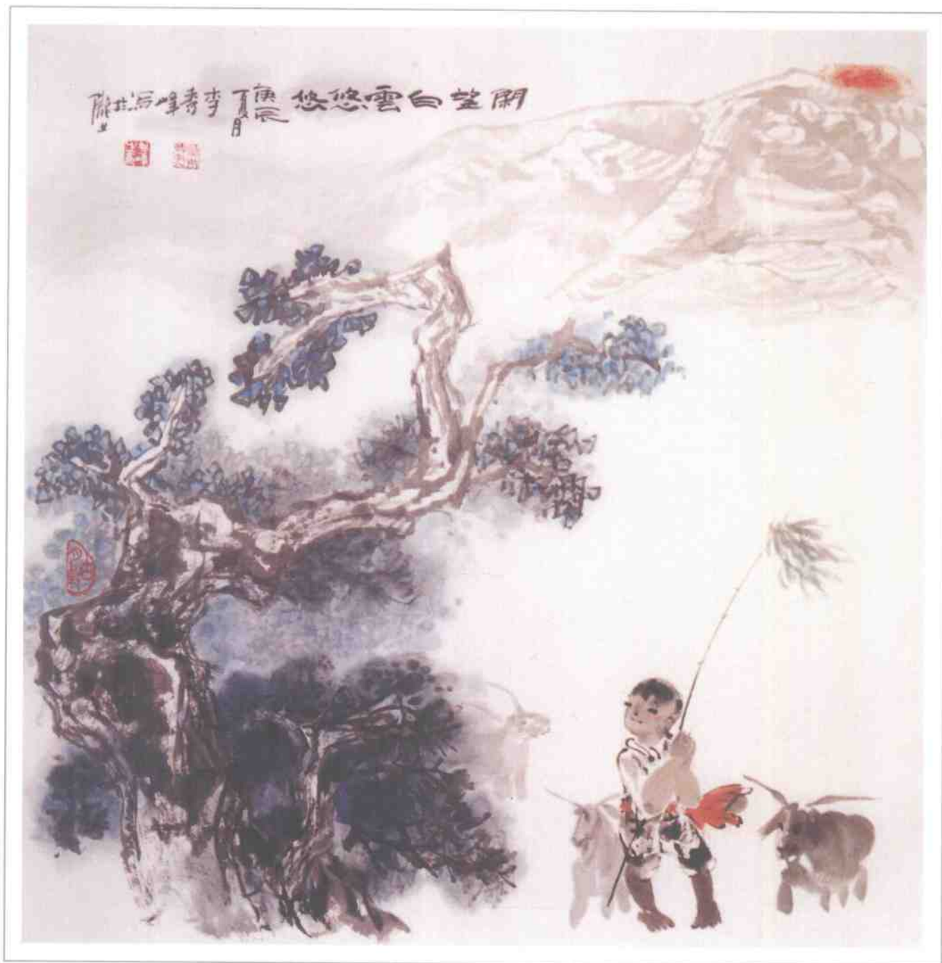
• 闲望白云悠悠 • White Clouds Floating Carefreely