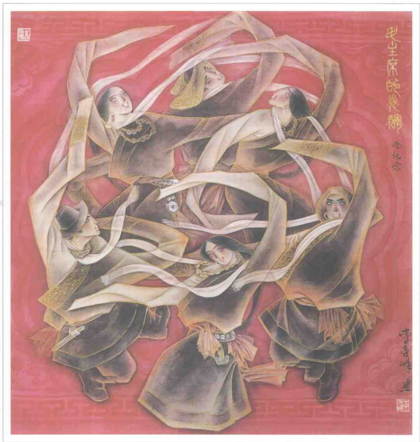
● 欢歌劲舞 ● Singing and Dancing Joyfully