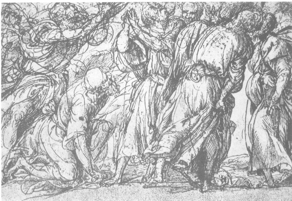
图4 提香 《使徒们“圣母升天”习作》