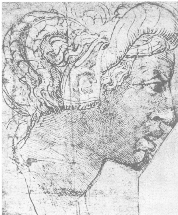
图2 蒙特鲁坡《戴土耳其头巾的妇女》