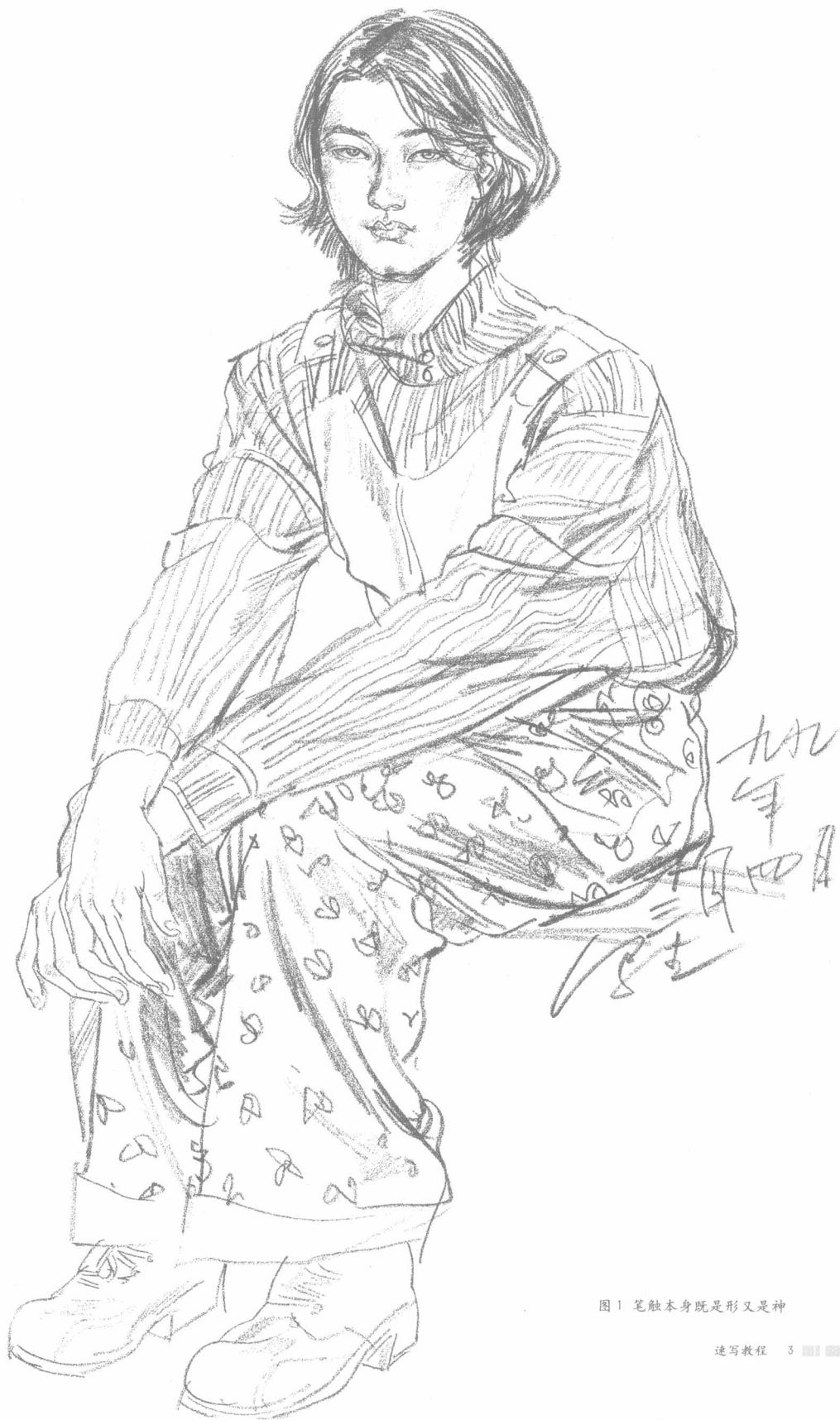
图1 笔触本身既是形又是神