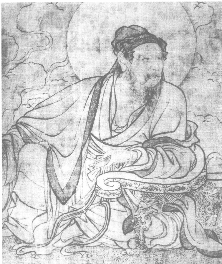
图6 李公麟《维摩诘演教图》

对“结构”意义的拷问直接影响了作为以形写神之人物画的整体发展，或多或少地矫正着抛开形的研究，于“写意”概念上信马由缰地无意识“滑行”的弊端。从素描速写中体会的造型意识和造型手法，都为中国艺术增添了新的观念新的样式。甚至可以说，它成了描绘现实主义题材和写实观念造型的主要凭借与依据。中国画中，那些大胆借鉴素描的实证意识，在形体、明暗、色彩等方面探索的样式，比如蒋兆和对结构和光影明暗的探索（图7），黄胄对速写率性笔意的探索（图8），“红色年代”人物画对现实主义样式、图式和体感、空间、色彩的探索等，在整个画史上则有着开拓性意义。