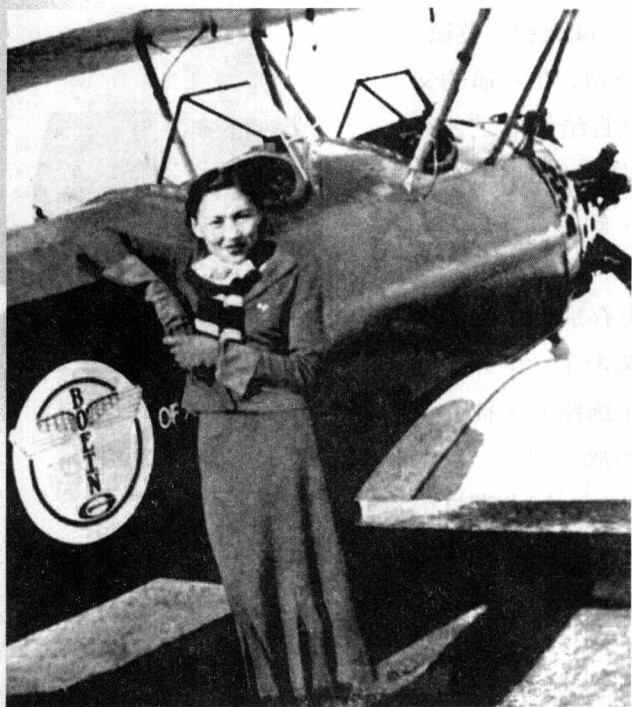
上图：1936年，中国女子飞行第一人李霞卿回到上海。