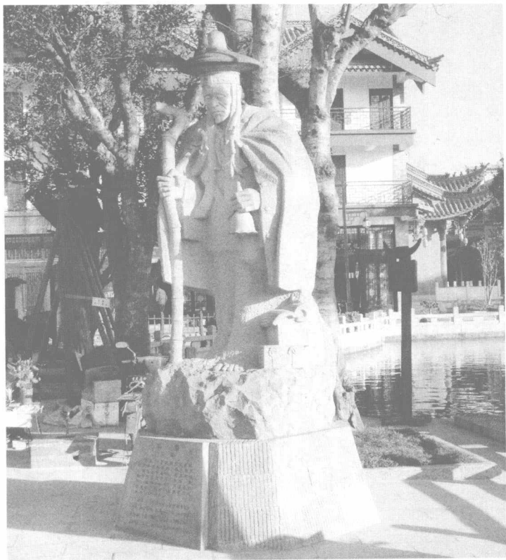
位于彝人古镇火塘会的彝族古文化知识分子——毕摩雕像

人首先感受到彝族建筑文化的氛围，首先得到彝族建筑文化的熏陶，提升美丽彝州的魅力，又用彝族建筑文化产业来带动其它文化产业的发展，形成彝族建筑文化产业的品牌效应，扩大楚雄州在国内外的知名度，让更多的人了解楚雄、认识楚雄、建设楚雄，以利于打造彝族文化精品，以利于发展彝族文化产业，以利于建设彝族文化名州。