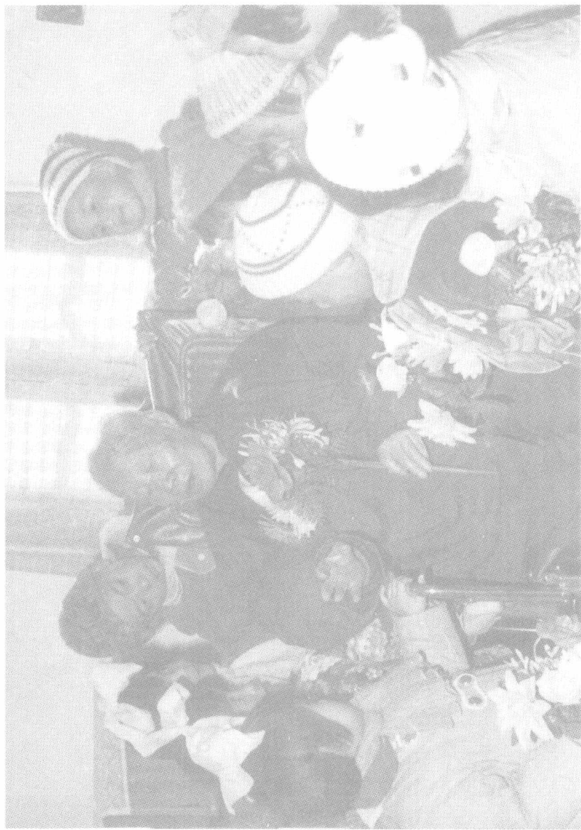
1982年元旦，鼓楼幼儿园小朋友到陈老家中向老园长爷爷拜年。