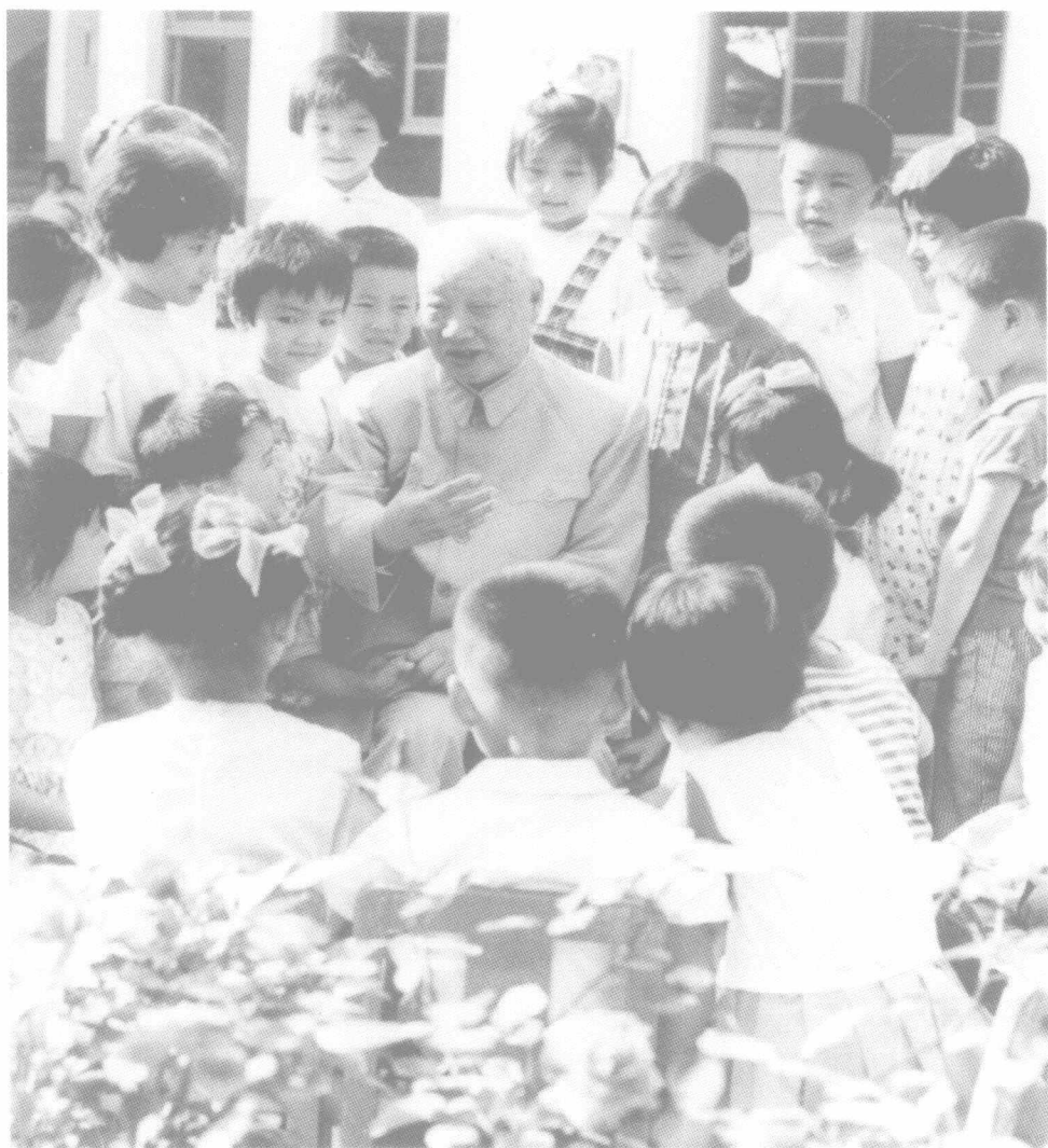
1977年，陈鹤琴在南京鼓楼幼儿园给小朋友讲故事。