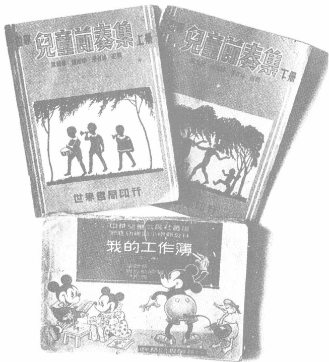
陈鹤琴编写的部分手工和音乐教材。