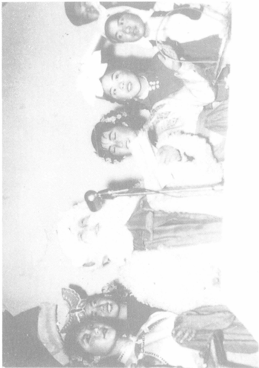
1955年，陈鹤琴院长扮新年老人与南京师范学院同学同乐，欢度新年。