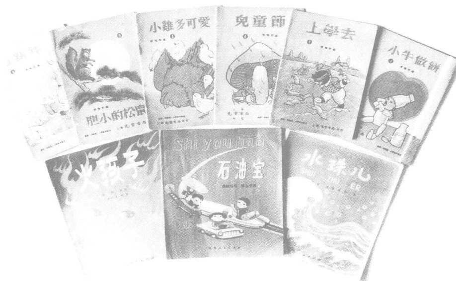
陈鹤琴编写的部分幼儿读物。