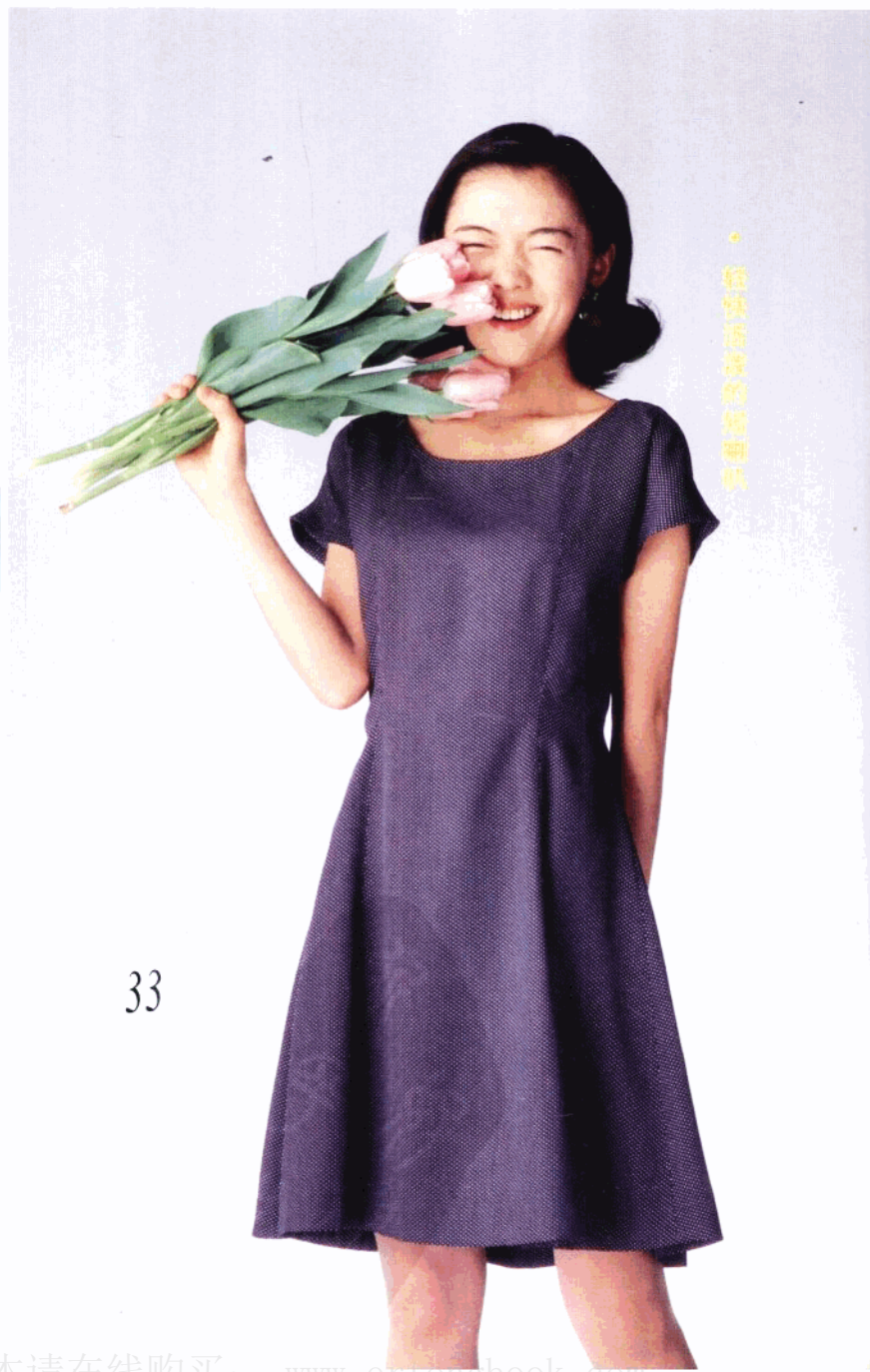
· 轻快活泼的喇叭裙