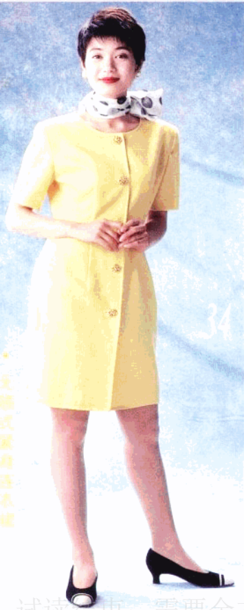
· 无袖式家居连衣裙