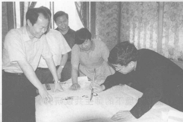
著名学者余秋雨为“新作文”题字