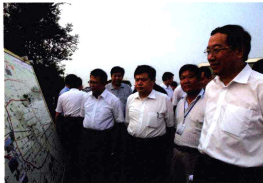
省委常委、市委书记王文超考察西绕城公路改建情况