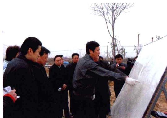
市长赵建才指导林业建设