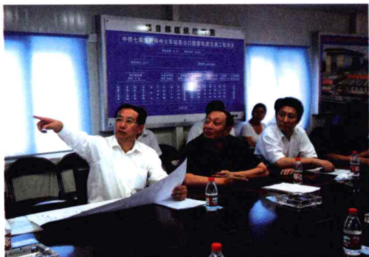
省委常委、市委书记王文超指导重点工程建设