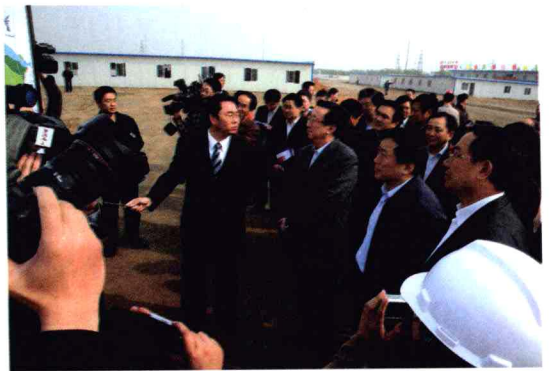
省长郭庚茂考察综合交通枢纽配套工程