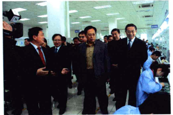
省委书记徐光春在高新区企业考察