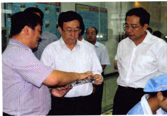
省长郭庚茂考察科技自主创新工程企业