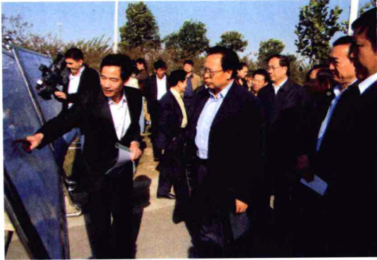
省委书记徐光春考察郑汴产业带建设