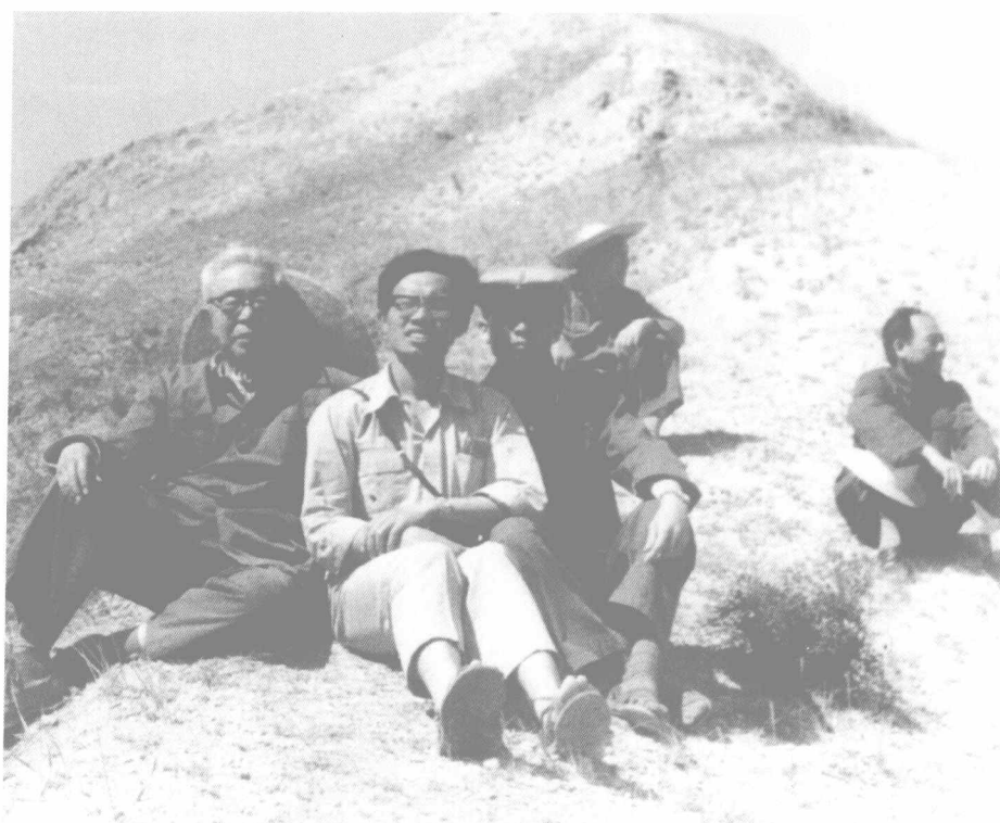
1979年6月贾兰坡考察河北阳原小长梁遗址