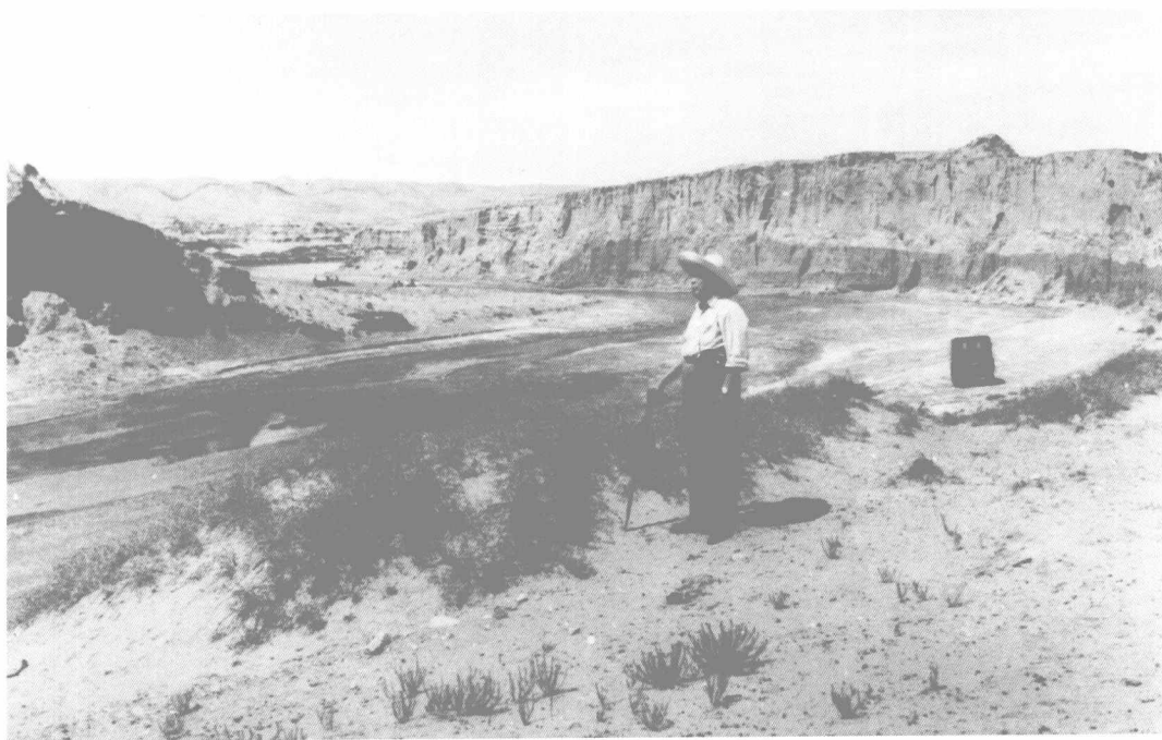
1974年9月贾兰坡考察宁夏灵武水洞沟遗址