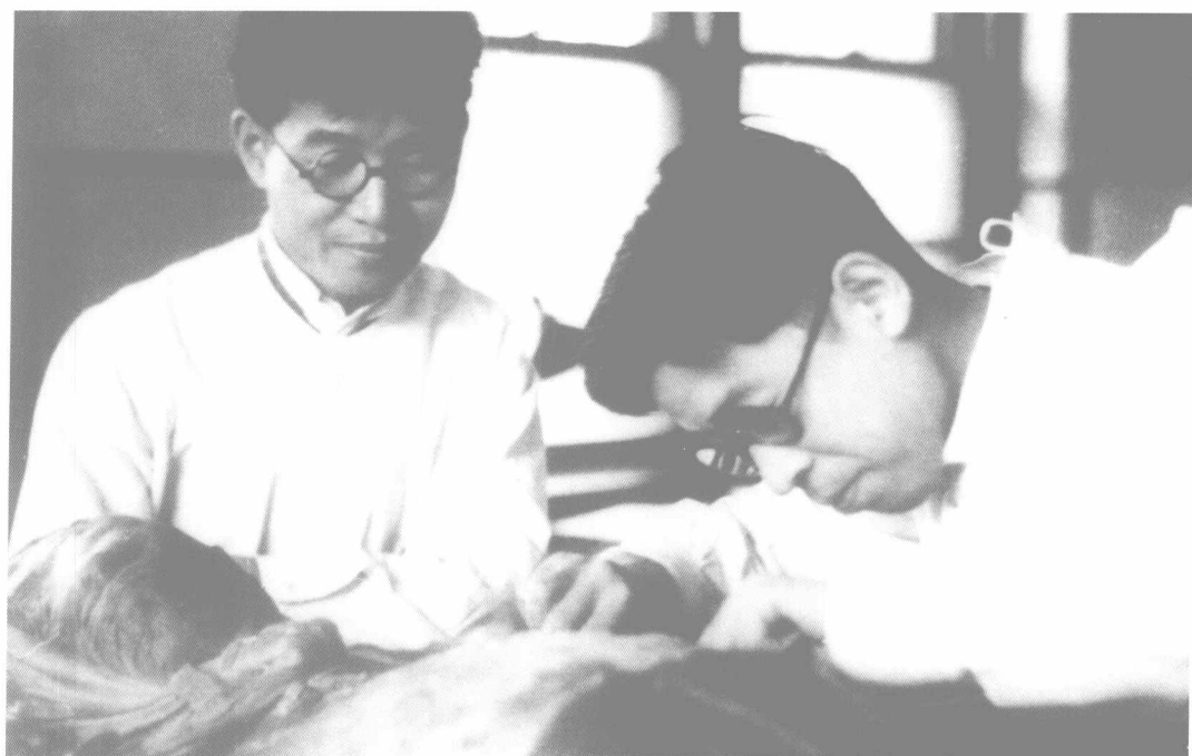
1939年贾兰坡到北京协和医院学习人体解剖学