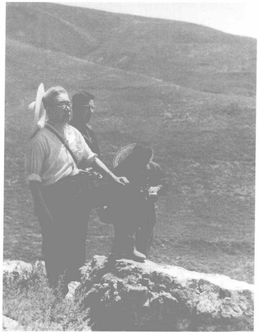
1974年8月贾兰坡 考察内蒙古大窑遗址四道沟地点