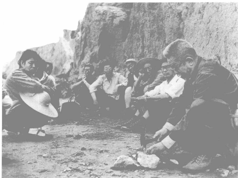
1976年贾兰坡指导许家窑遗址发掘