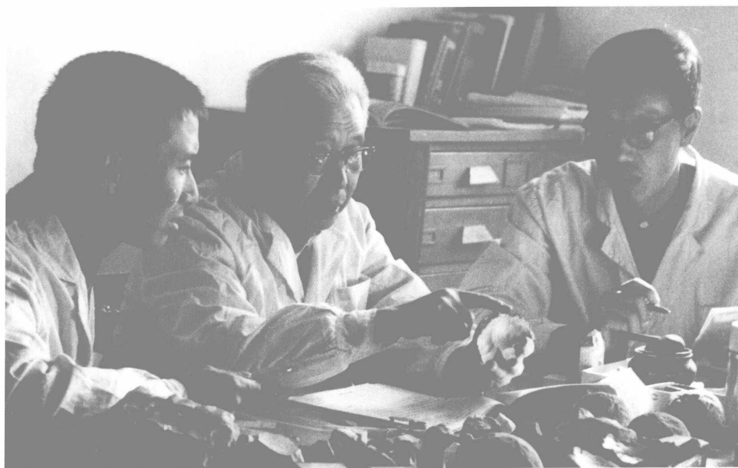
1976年贾兰坡和同事们研究许家窑遗址的文化遗产