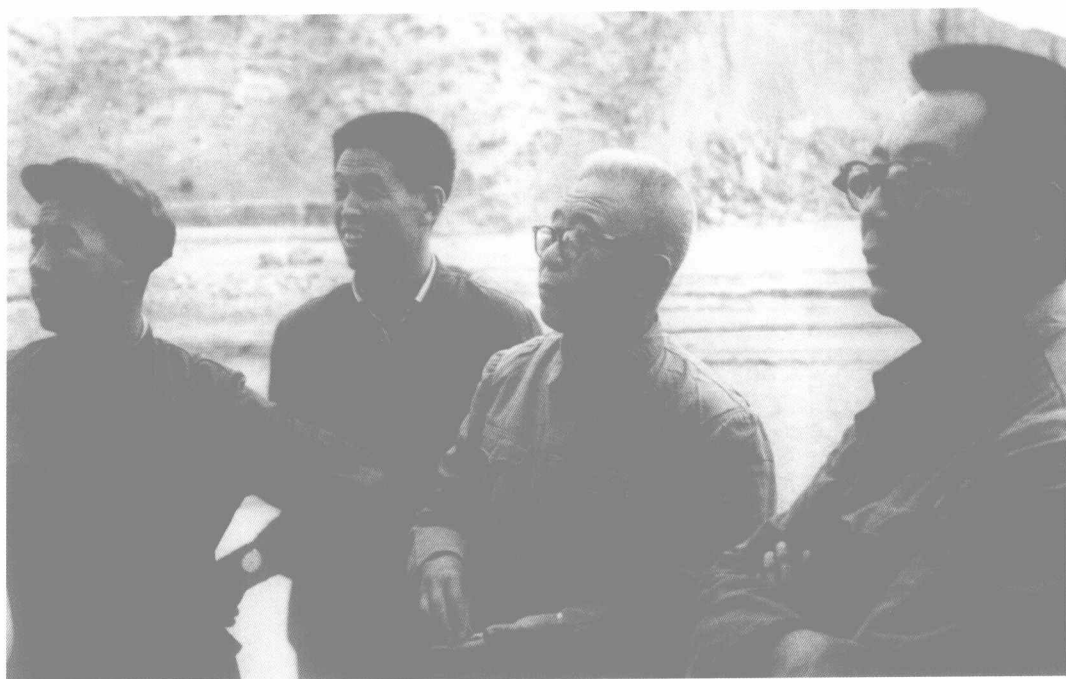
1974年贾兰坡考察宁夏灵武水洞沟遗址