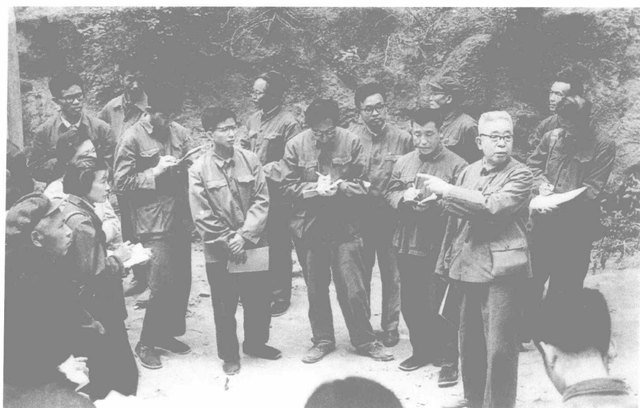
1978年贾兰坡在周口店给培训班学员讲课