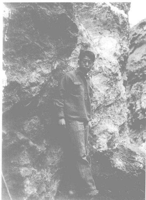
1936年11月2日贾兰坡在周口店第1地点