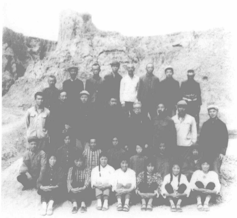
1976年贾兰坡主持许家窑遗址发掘时合影