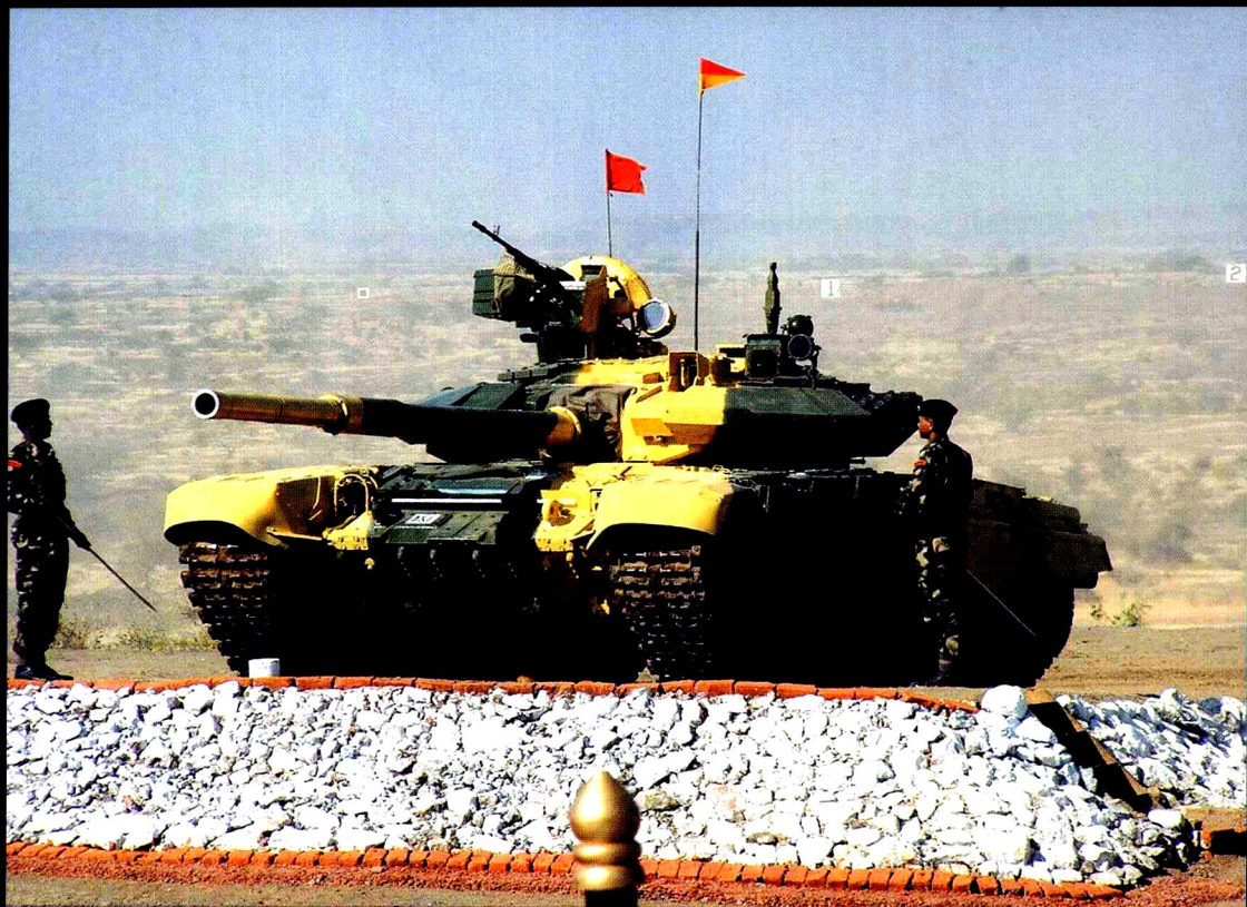
印度军队的 T-90 坦克