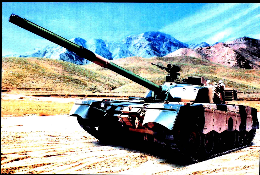
我军 99A2 型主战坦克