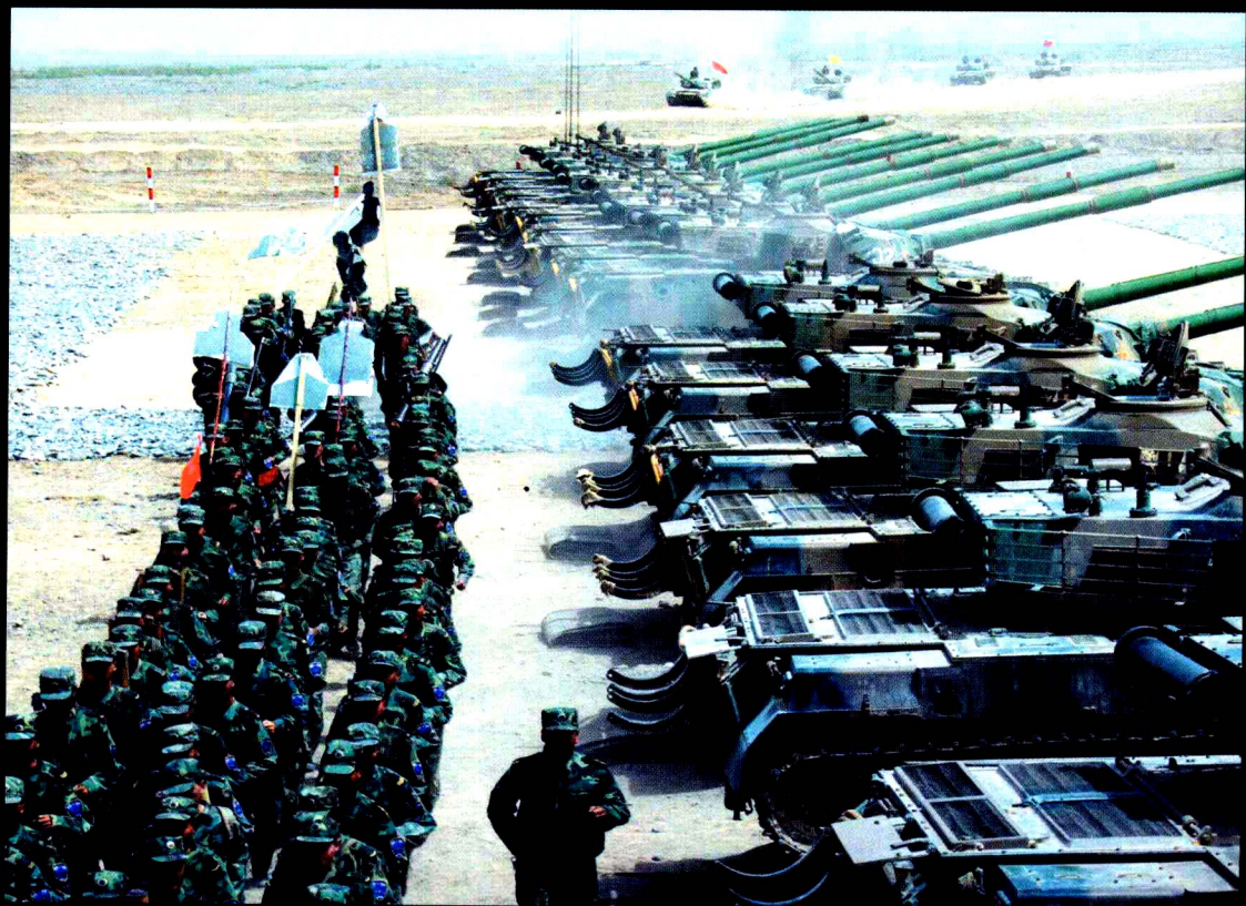
行驶中的我军坦克部队