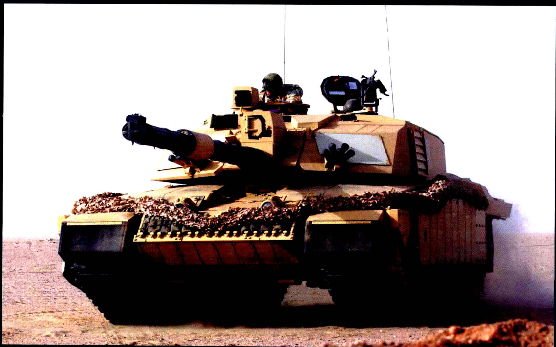
英国“挑战者”式坦克