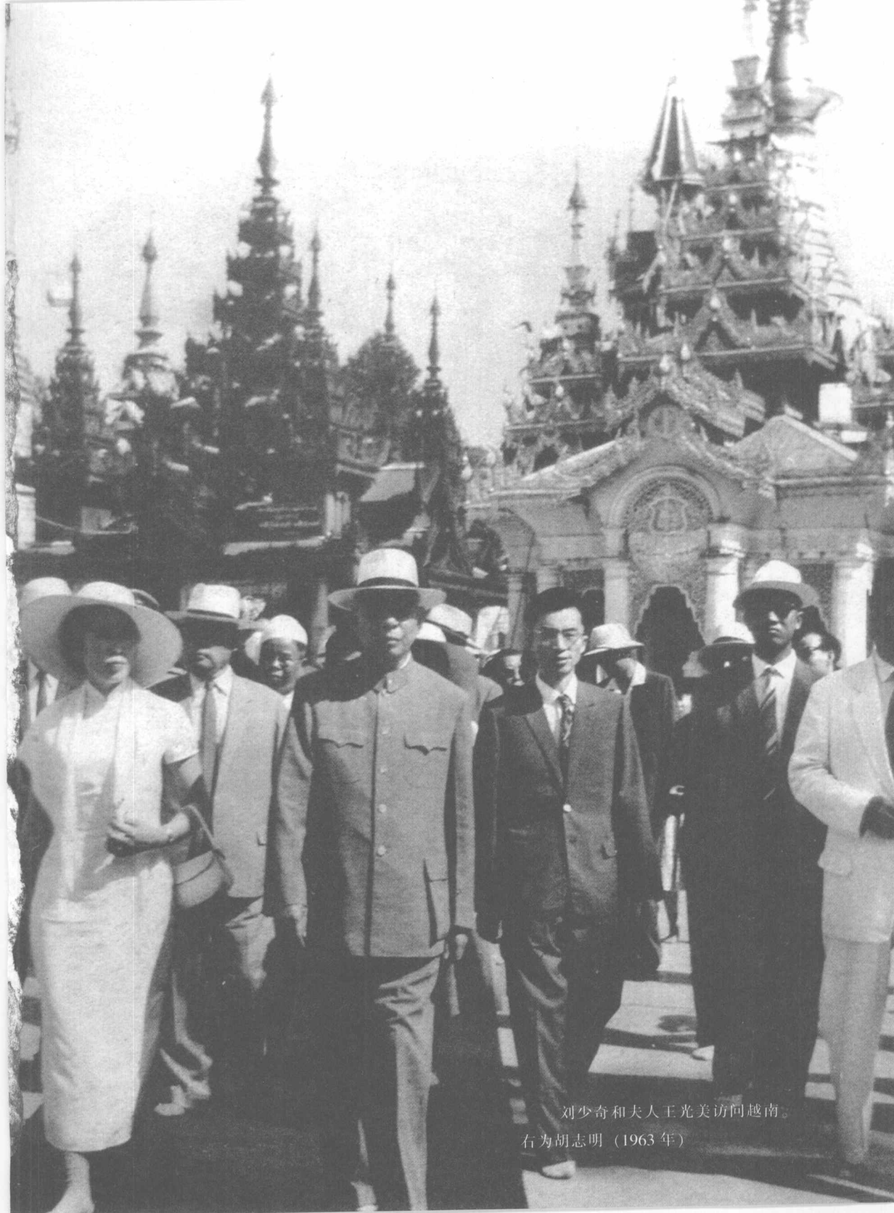
刘少奇和夫人王光美访问越南。 右为胡志明（1963年）