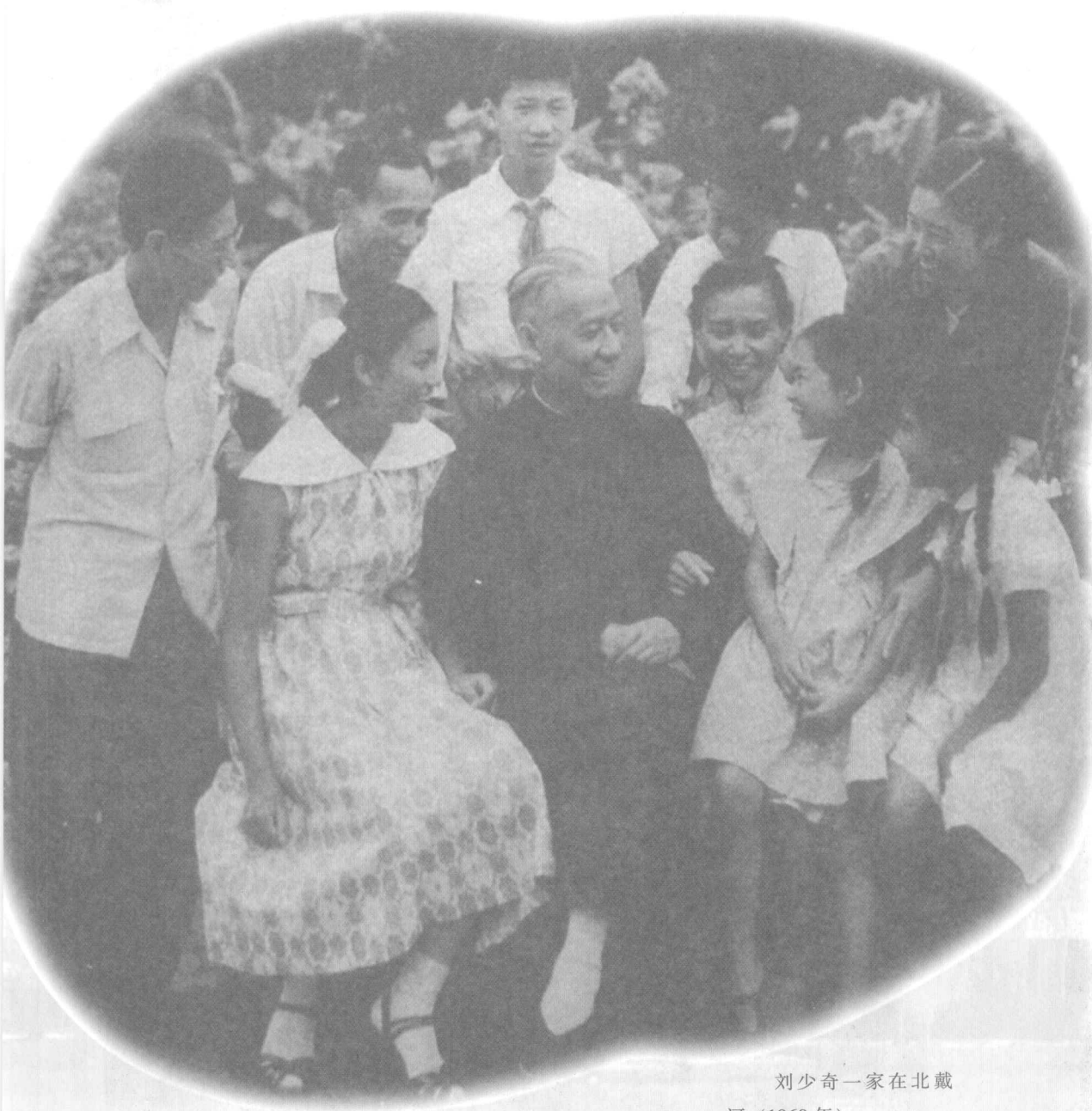
刘少奇一家在北戴河（1960年）