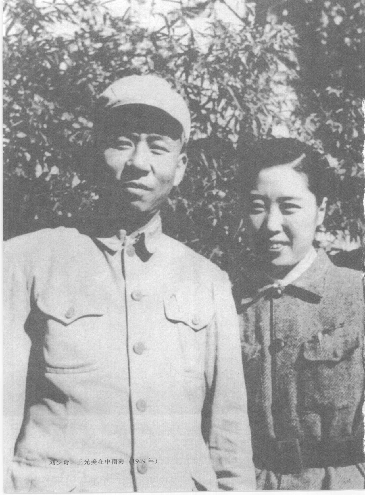
刘少奇、王光美在中南海（1949年）