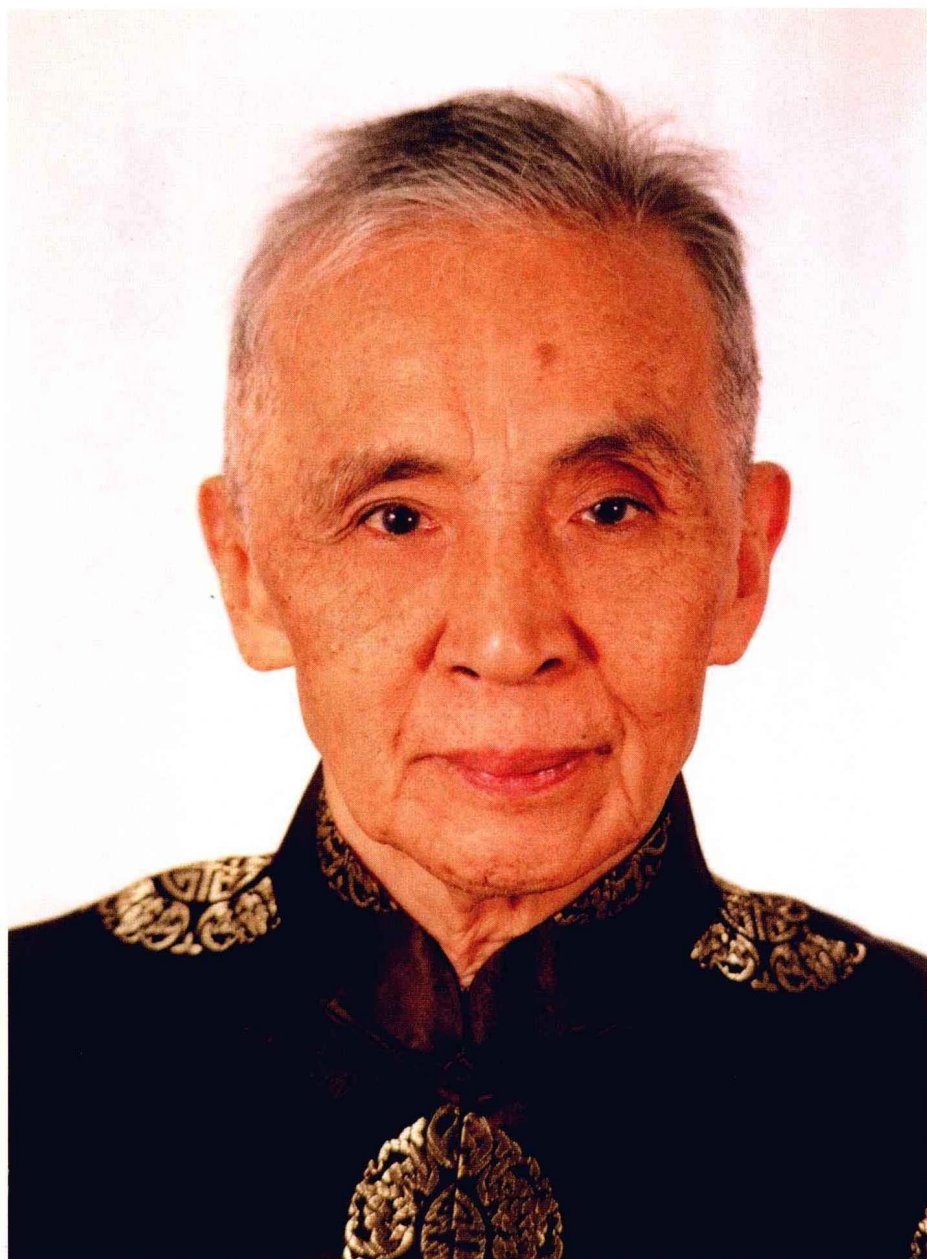
杨佛兴大阿阇黎道影