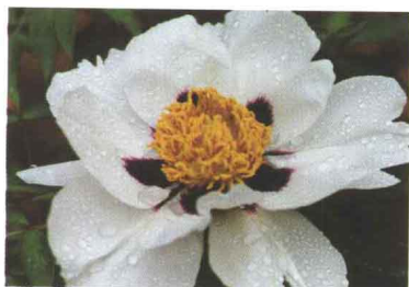
‘书生捧墨’ Shu Sheng Peng Mo/79