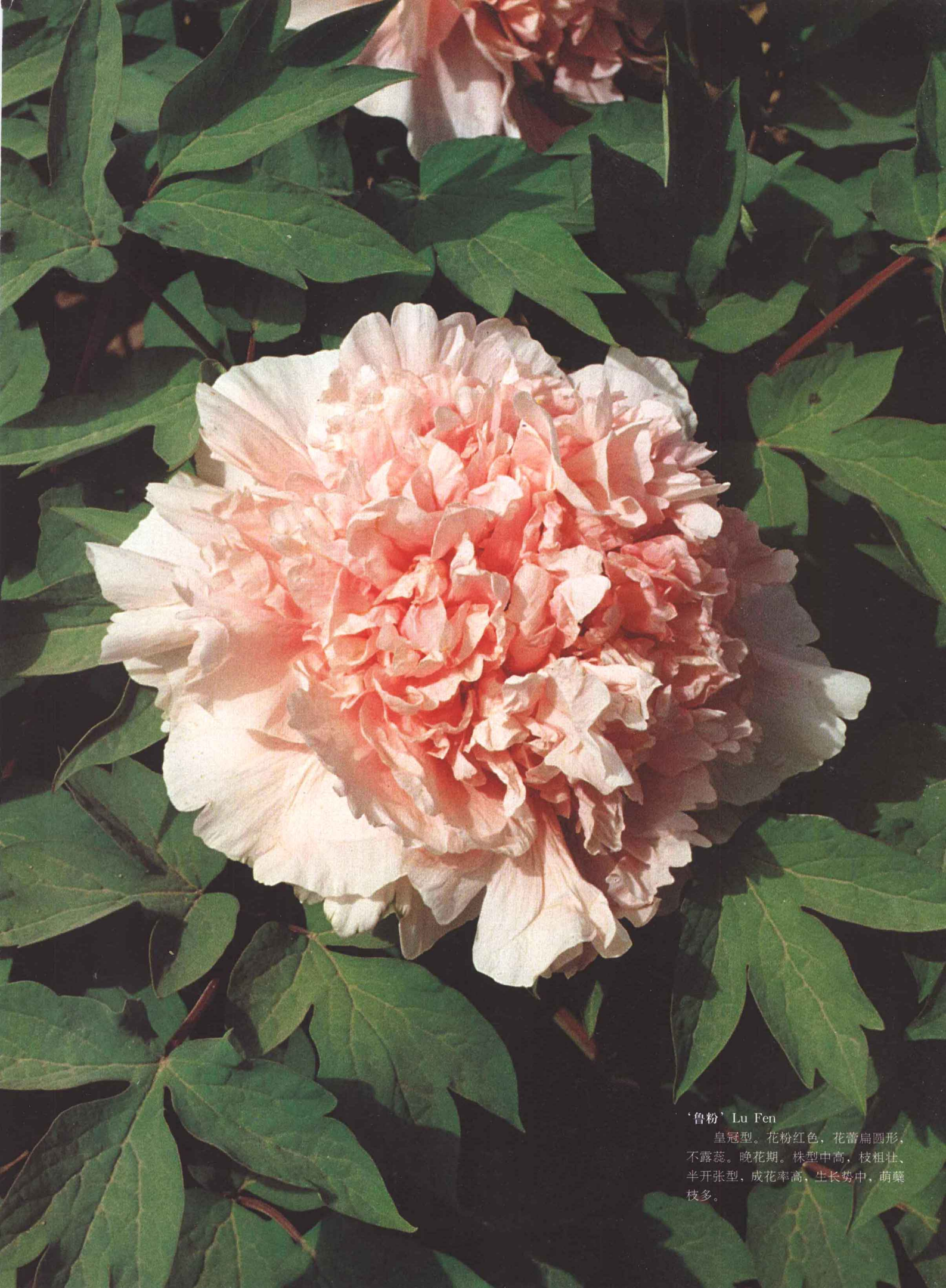
‘鲁粉’ Lu Fen

皇冠型。花粉红色，花蕾扁圆形，不露蕊。晚花期。株型中高，枝粗壮、半开张型，成花率高，生长势中，萌蘖枝多。