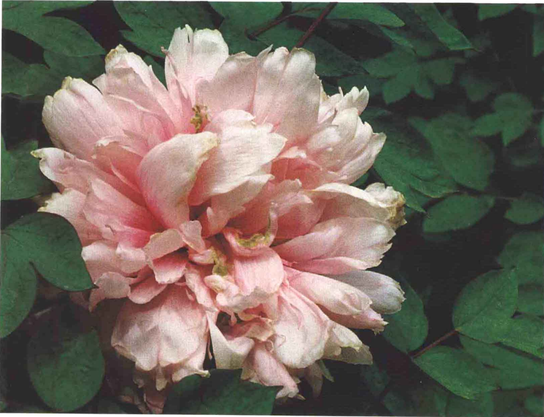
◀ ‘玉楼春’ Yu Lou Chun

皇冠型。花粉色，花蕾扁圆形，不露蕊。中花期。株型高大、开展、直立，枝粗壮，成花率高，生长势强，萌蘖枝少。