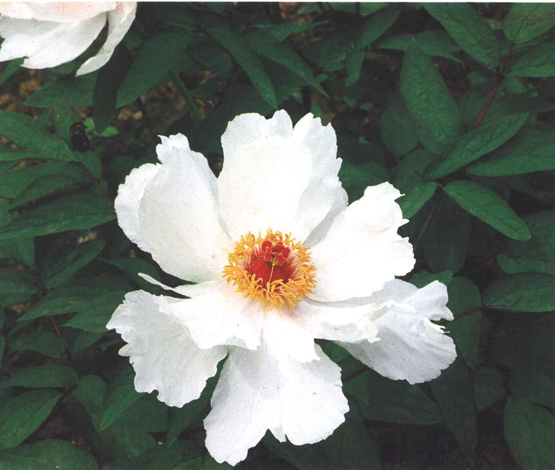
◀ ‘凤丹白’ Feng Dan Bai 单瓣型。花白色，花蕾圆尖形，露 蕊。早花期。株型高大、直立，枝粗壮， 成花率高，生长势强，萌蘖枝少。