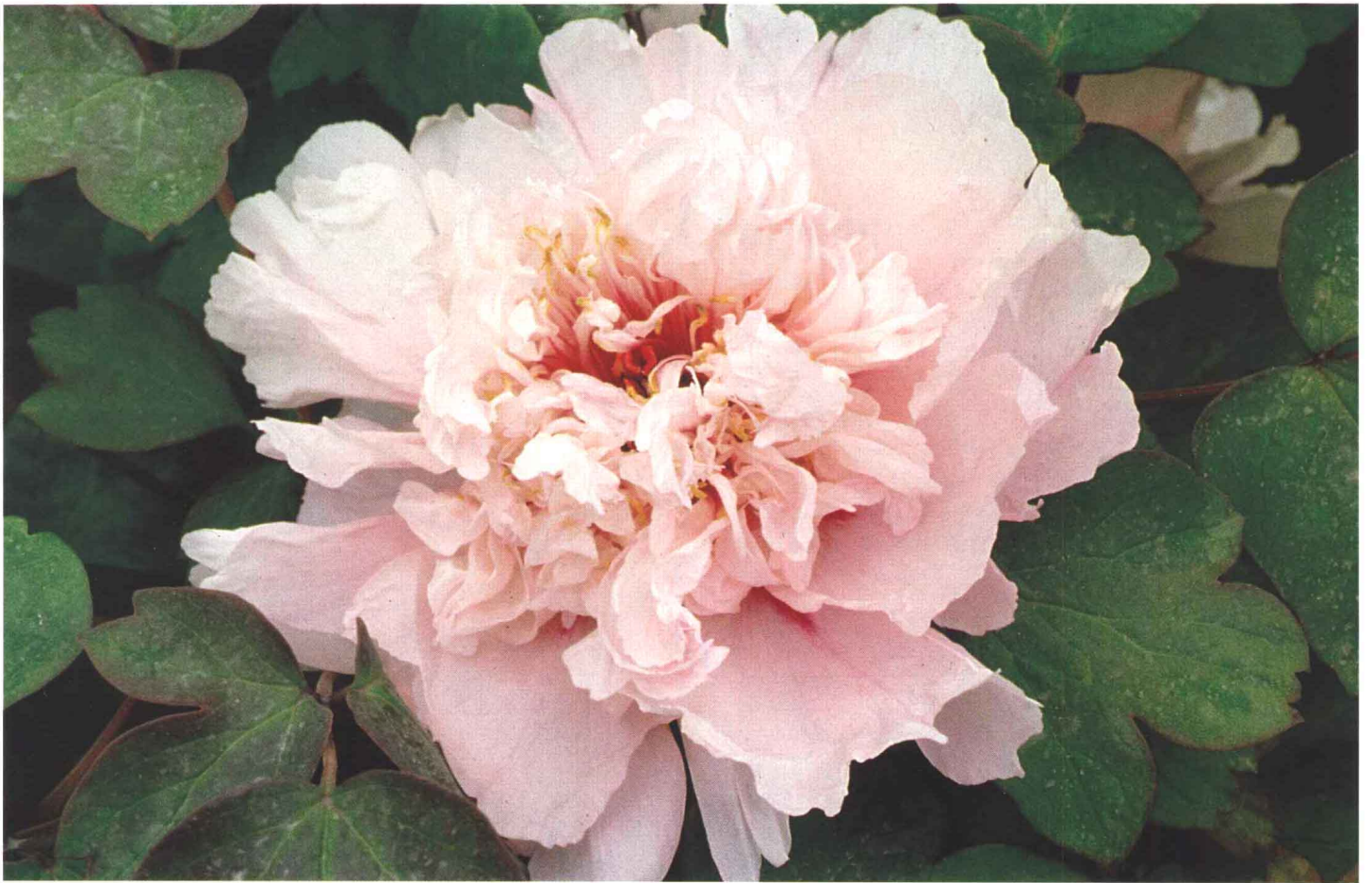
▲ ‘雨过天晴’ Yu Guo Tian Qing 皇冠型。花粉蓝色，花蕾圆尖形， 重瓣不露蕊。中花期。株型矮，半开展， 成花率高，生长势弱，萌蘖枝较少。