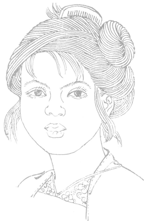
侗族女子頭部裝飾