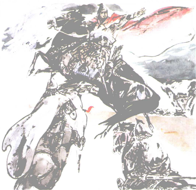
伏波将军 马援建昆仑关