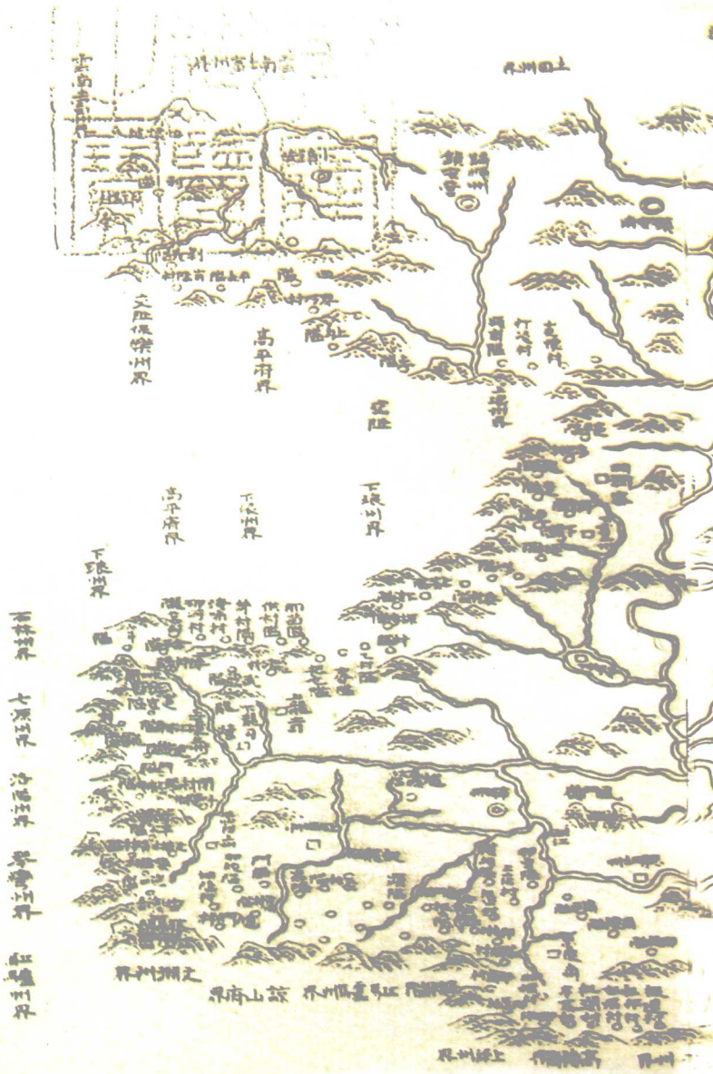
清文渊阁四库全书《广西通志》卷五所载《广西通交陆隘口图》