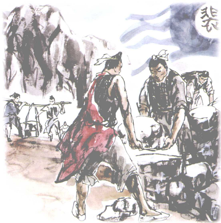
唐代桂管观察使裴行立建关

唐元和二年(807年),西原州(今扶绥县地)黄峒首领黄少卿利用诈降后被封为归顺州(今靖西县)刺史时机,重新集结力量,起兵反唐,十一年(816年)攻占钦(今钦州市)、宾(今宾阳县)、峦(今属横县)、岩(容管地,与今贵港市、横县相邻)等州。朝廷调安南都护经略使裴行立任桂管(治今桂林市)观察使,十四年(819年)和容管(治今容县)经略使阳旻奉命进剿黄少卿等部,为堵截黄少卿部由宾州(今宾阳县)进犯邕州(治今南宁市),选择险恶的宾州石龟塘山峡、石塞坳及宣化县昆仑关,“缮兵补卒”,屯驻重兵,“增垒闭途”,卡塞驿道,垒石为关,建成坐南向北、攻守兼备的互为犄角的军事防线。前哨石龟塘在主垒昆仑关隘北2公里,东有界首山,西有罗伞山,古驿道所经的山峡,对北面居高临下,有利防守邕州。当年石龟塘、昆仑关、石塞坳垒石,后用来铺设驿道的石阶,至今犹存。