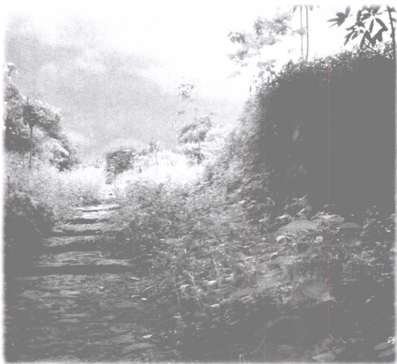
昆仑古道第一道关