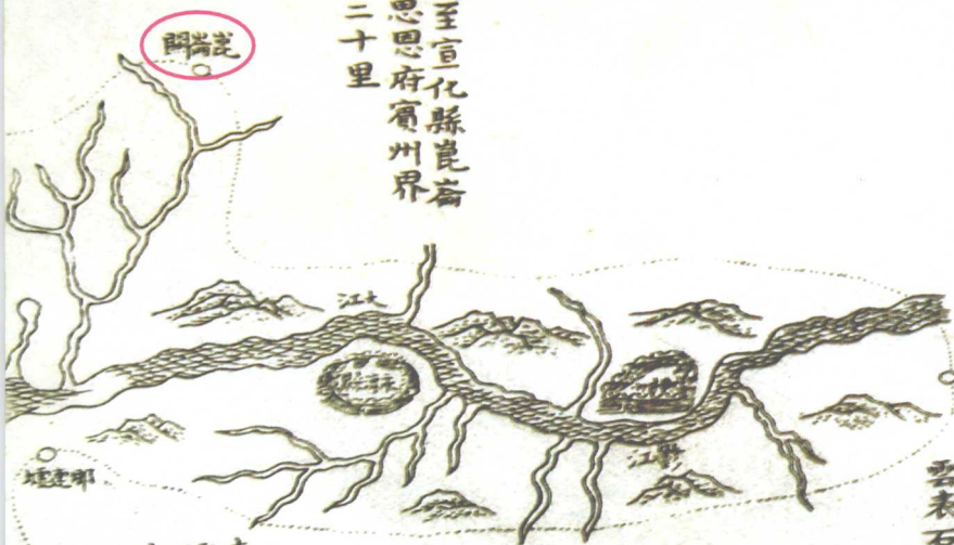
清文淵閣四庫全書《廣西通志》卷五所載《南寧府》地圖