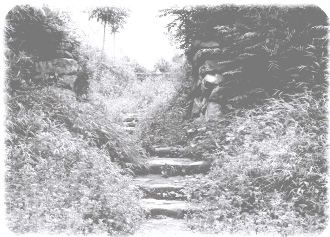
昆仑古道第二道关