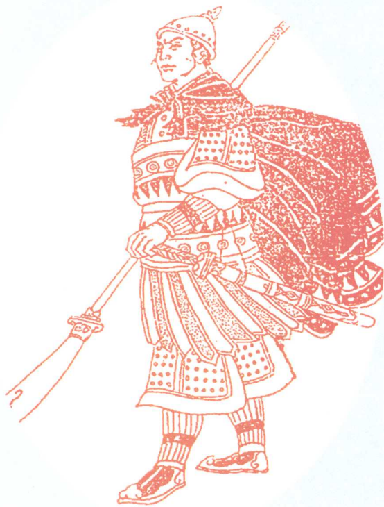
邕州属羁縻州广源州首领侬智高

北宋皇祐四年(1052年)四月,邕州属羁縻州广源州首领侬智高率众五千发动反对宋王朝的武装斗争。五月攻占邕州,建立“大南国”,自称“仁惠皇帝”,改元启历。兵员增至一万多人。不久挥师沿郁江东下,很快占领今广西东部及广西西部大片地区。七月抵达广州城下,围攻57日不克,退回广西。十月破宾州,复据邕州,一面聚集力量,欲攻广州“以自王”,一面分兵把守邕州北部屏障昆仑关,并给予加固。