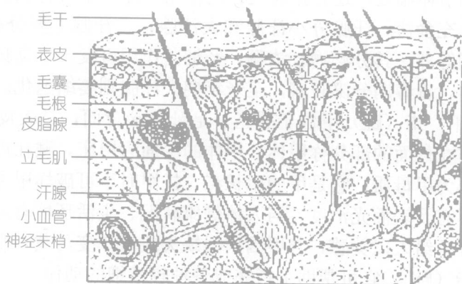
图 1-2 皮肤的附属器示意图

毛发的结构可分为毛干和毛根两部分。毛干露于皮肤的外面，由含有黑色素的角化细胞构成，色素含量多少决定毛的颜色。毛根埋在皮肤内，并被毛囊包裹。毛根和毛囊的末端膨大，称毛球，毛球底面向内凹陷形成毛乳头，给毛球提供营养，也是病理变化的中心场所，如若毛乳头被破坏和退化，毛发即停止生长并脱落。毛球是毛发和毛囊的生长点。毛球含有毛母质细胞，毛母质细胞间的黑素细胞能将色素输入新生的毛根上，从而形成毛的颜色。