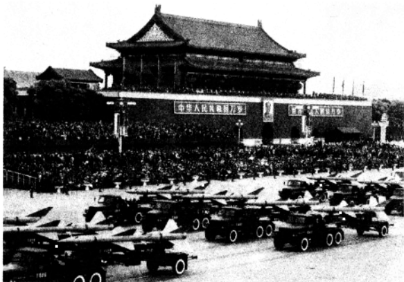
强大的国防是国家安全的保障

政权，国防是国家赖以生存的根本保证。国防是为国家利益服务的。国家利益是国家的最高国防，是国家和民族安全的保障，是国家和民族生存与发展的根本前提。国家的性质、制度决定着国防政策。奉行强权政治的霸权主义国家，其国防政策具有扩张性和侵略性；奉行独立自主、维护和平的国家其国防政策具有防御性和自卫性。我国是社会主义国家，国防政策具有明确的反侵略和自卫性质。当然，世界各国无论其发展模式怎样不同，发展阶段如何差异，国防建设却是各国始终如一的建设重点。