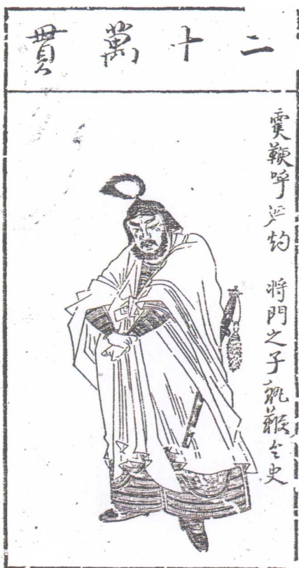
图12 《水浒叶子》 陈洪绶