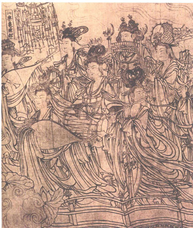
图4 《朝元仙仗图》 (局部之二) 武宗元