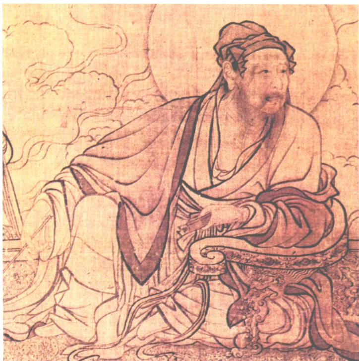
图8 《维摩诘图》 (局部之二) 李公麟