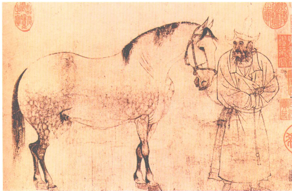
图6 《五马图》 (局部之二) 李公麟