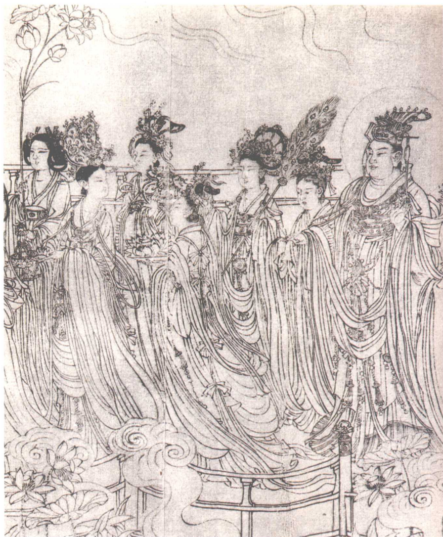
图2 《八十七神仙卷》 (局部之二) 吴道子

在实际教学中，学生首先要做到线条的均匀流畅，画好面部五官则是更高的要求。此画面的人物头部很小，但五官结构要刻画得细致而结实，具有很大的难度。