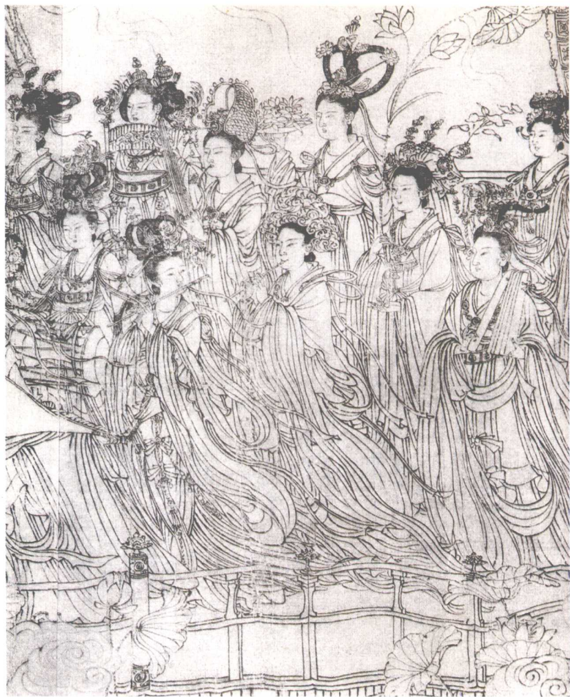
图1 《八十七神仙卷》 (局部之一) 吴道子

这幅作品是道观壁画的粉本，描绘东华天君和南极天君与众仙官、侍从、天女等神仙一同去参拜元始天尊的情形。线条风格继承了唐代吴道子的画风，人物衣纹有统一的向右的飘动感，使人感觉神仙队列自右向左的运动。人物表情描绘生动传神，表现了帝君的庄严、神将的威武和仙女的端庄。五官的刻画用笔简洁肯定。对衣纹线条的处理十分讲究，虽然所有的衣纹都有共同的朝向，但在大组的衣纹之间有着微妙的角度变化，并且有适当的松紧和疏密变化，以此来区别前后关系。其中飘带构成的圆弧线条与纵向的衣纹线条形成对比，在大的疏密安排上，人物的衣纹大致属于同一个层次。而前景的云