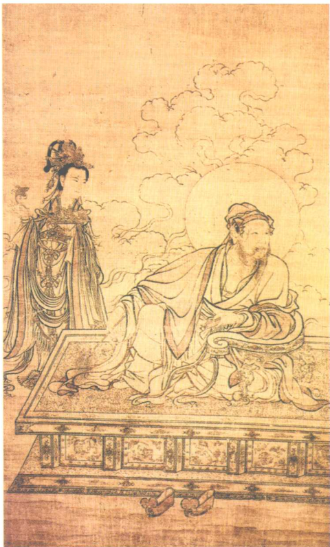
图7 《维摩诘图》(局部之一) 李公麟

李公麟把白描发展成为一种独立的艺术形式，排除了渲染颜色的技法，同时加入了白描的多种对比因素，使白描的表现力大大提高。在《维摩诘图》中用较淡的墨色表现皮肤，用较浓的墨色表现帽子和衣服，用粗细变化大的兰叶描和颤笔描法分别表现维摩诘和侍女的衣服不同的质感。胡须和拂尘用排线的方法表现为浓淡变化的灰色调。勾胡须时要先勾出中心最长的一根，然后再向两边一根根勾，疏密距离要平行均匀，线与线不能相碰。床榻的直线规矩严整，与放松的衣纹和云纹形成对比。可用界尺方法勾出床榻上的图案，细致均匀，构成一片灰色调，衬托出人物主体形象。临摹中要细心练习图案的画法，不可忽略。人物衣纹处理重视主次和空间的前后关系。临摹中对墨色要特别加以把握。此作品墨色从重到淡分为很多层次，而每一层次中又有细微的变化。不管变化多丰富，根据不同物象的感觉应用不同质感的线条。这就是李公麟白描人物画的特点，也是在临摹中需要认真体会之处。