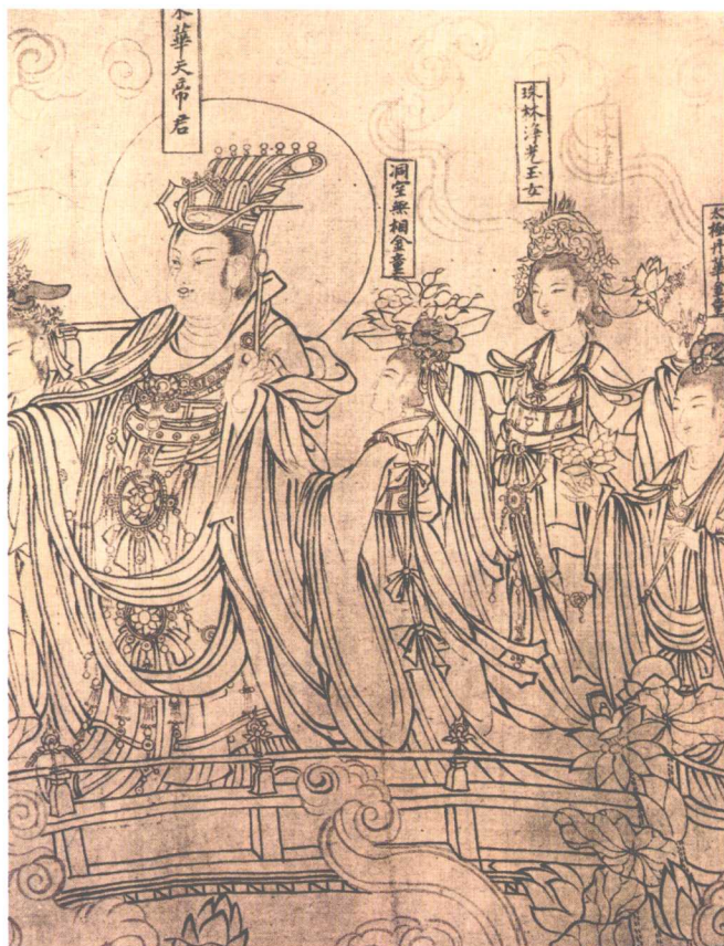
图3 《朝元仙仗图》 (局部之一) 武宗元

这幅作品是绢本，因此在勾线的感觉上与纸本的《八十七神仙卷》不太相同，画幅也稍微大一些。用笔的粗细变化很大，在转折处线条变粗，变化多端，面部和手都用淡墨勾线，眼眉用重墨，人物造型更加丰满，脸部比较胖，身材较矮，临摹时更加需要功力。书法用笔的感觉很强，临摹中要把作品潇洒自信的感觉临出来。