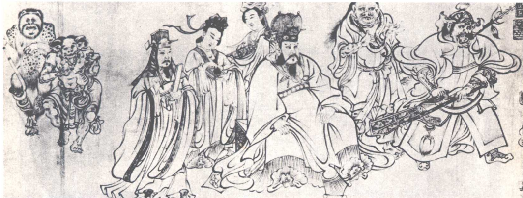
图9 《送子天王图》 吴道子

临摹中粗细变化比较难掌握。用笔要讲究提按的变化，还要控制整体的节奏和韵律感。总的虚实规律是衣纹收紧处实，放松处虚；人物外轮廓线实，内轮廓线虚；在前面的线实，在后面的线虚。临摹这样的作品要选取适合于提按和转折变化的勾线笔。