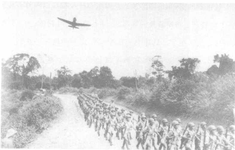
1943年10月，在P-40战斗机掩护下，中国军队向北缅进军

十月二十九日，他们击破了敌人的抵抗，进入了更的宛河上游诸流汇合的地区；占领了被敌人占领了一年多的新平洋，和泰