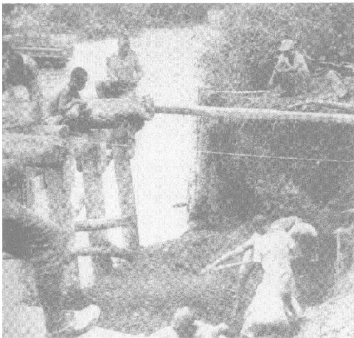
中国远征军正在缅甸修复一条被大水冲毁的桥梁

临滨于邦我军之完全解围，开始向敌人转移攻势，始自圣诞前夜。我××部队派遣的扫荡队，经过精细的搜索和严密的部署，毅然向村庄西北敌中村中队冲击。这一场战斗，每一寸的进展都是披荆斩棘和冒险犯难：在一片阴森的原始森林里，上面有敌人以钢板构筑的鸟巢工事；下面有俯拾皆是的触发地雷；部队