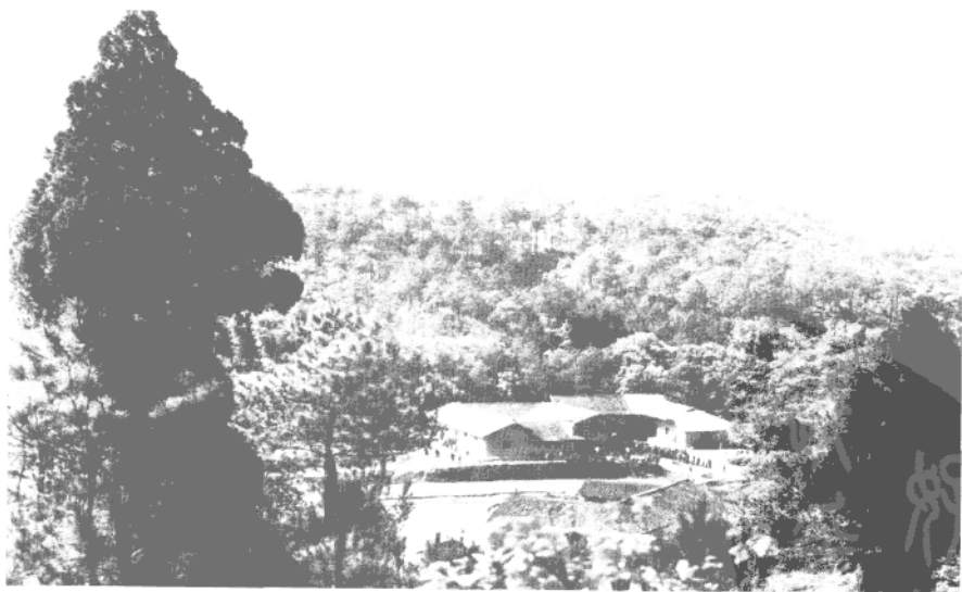
毛泽东故居——湖南省湘潭县韶山冲上屋场。1893 年 12 月 26 日(清光绪十九年十一月十九日),毛泽东诞生在这里。

一片绿色的山坡旁的小高地上是他家的四间房子,凶暴的父亲毛顺生掌管家庭大权。他身材瘦小,长相精明,留着髭须,一副干什么事情都急不可耐的神色。家里的 18 亩农田是他的城堡,他小心谨慎地操持着一切。