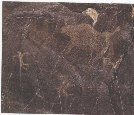
躲避野牛 追袭的人