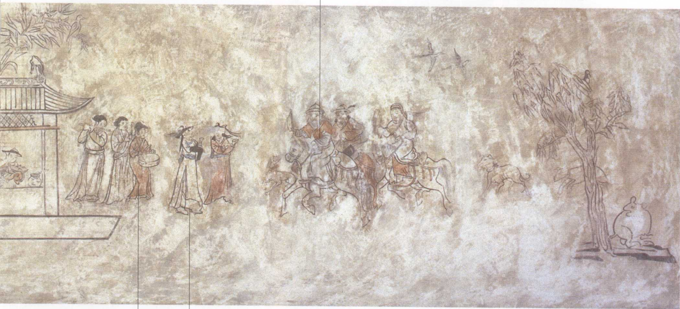
汉装女子 蒙古装女子