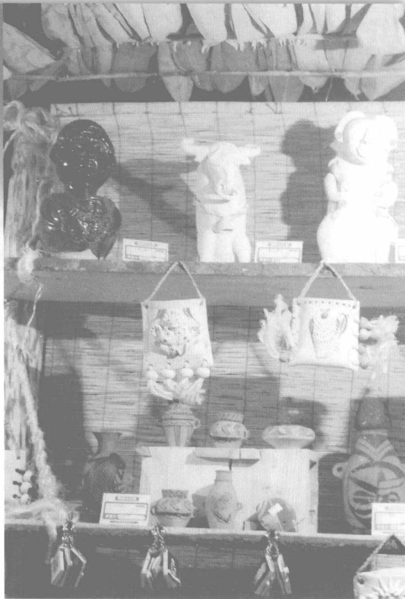
在北京《神秘的玛雅》展览会上展出的当代玛雅人制作的手工艺品

玛雅人,来自不同的种族,祖先是新石器时代的游牧民族。长期以来,研究者们一直在争论美洲人的来源,当地历史上有的传说与当今依然存在的争论焦点有些类似,即还是在阿拉斯加和遥远的亚洲相通的时候,他们通过白令“陆地桥梁”汇集而来。与之类似的一种说法以美洲地理学、古生物学的支撑为前提,据说还拥有实证,也在人类学研究方面产生了影响,即玛雅、阿兹台克、印加等民族,都是摇着独木舟、木排穿过海洋到达美洲的侨民。另一种观点也许是更多人所持的观点,认为美洲的基础性文化的基本特征在临近的文化中就可以寻得到。比如说玛雅人,他不是什么别的人种,就是玛雅人,一个相当“美洲化”的民族部落,如同印加人、火地岛人一样。玛雅社会是一个美洲社会,建立在血缘基础上的社会。它类似于其他一些种族农业社会之前的狩猎、捕鱼时代所发展起来的族群一样,玛雅人最终是这里神庙的建设者和文明的创造者。