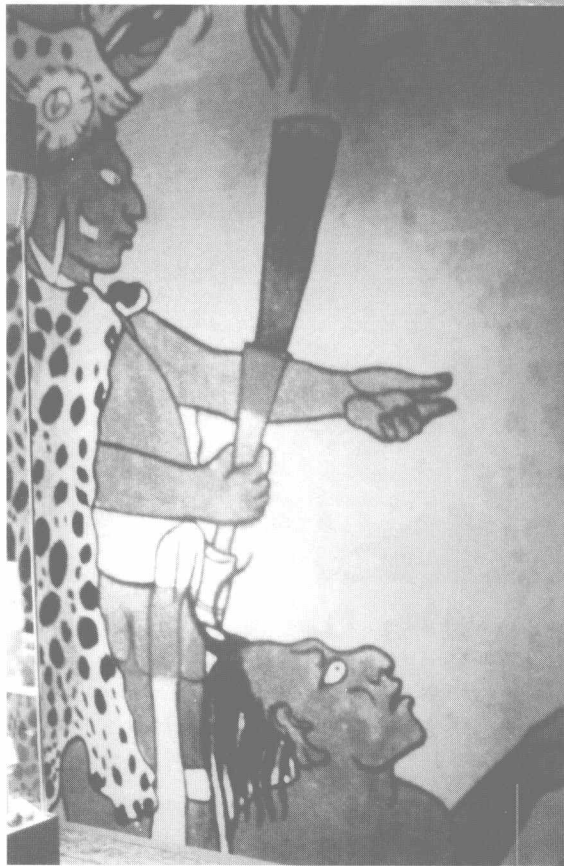
古玛雅人的标志绘画

20 世纪 80 年代我来到这里时,见到的依旧是一片荒凉。人烟稀少的沿海平原上,最多活跃的似乎是动物