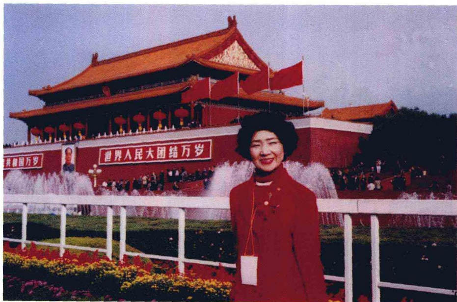
一九九九年应邀参加国庆五十周年庆祝活动时在天安门观礼台上留影。