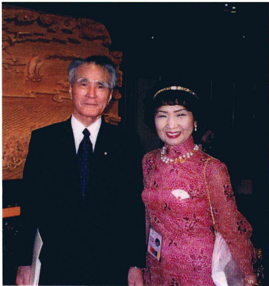
一九九七年香港回归庆典上，日本前首相村山富市与作者合影。