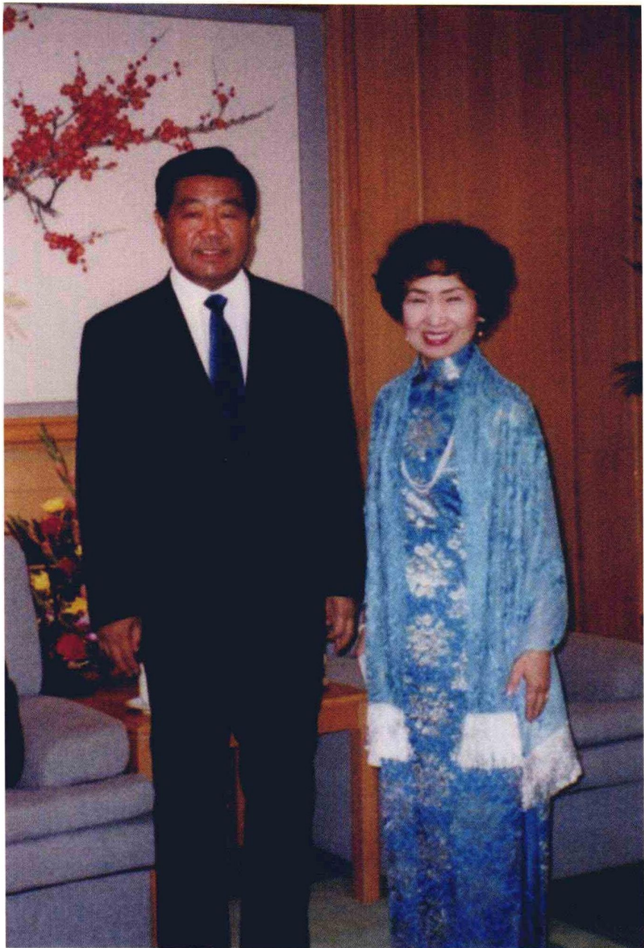
北京市委书记贾庆林接见“北京市荣誉市民”惠京仔。