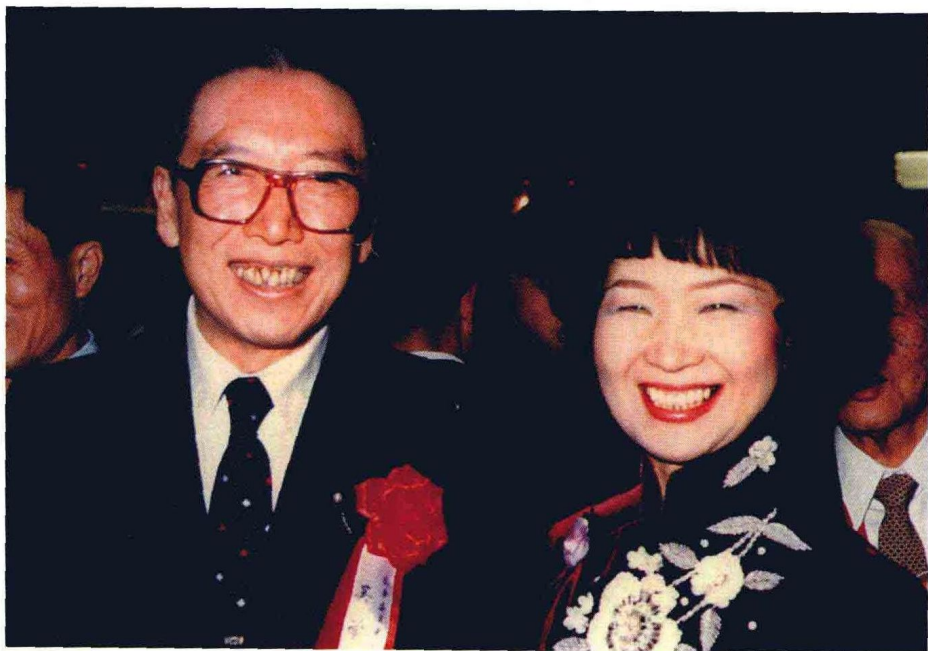
中国前副总理吴学谦与作者合影。