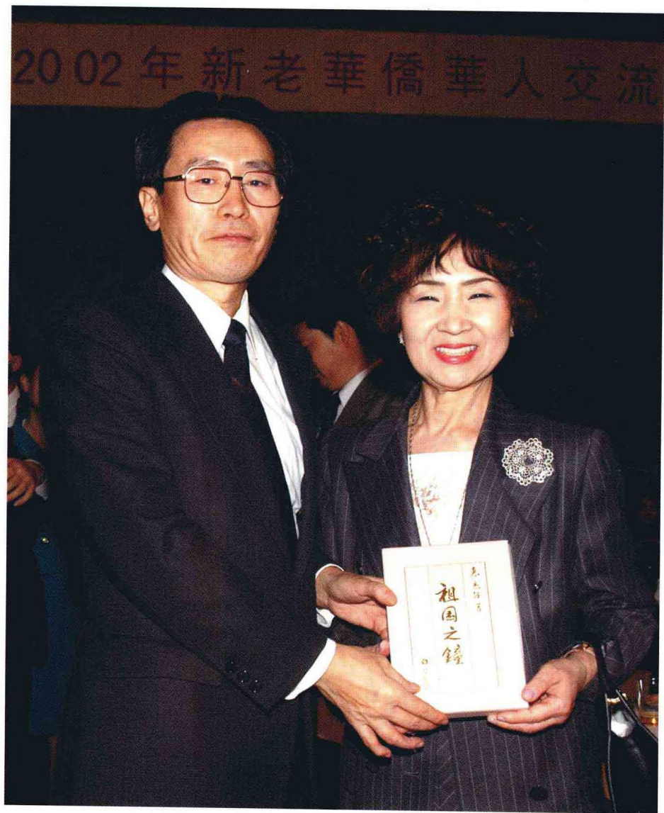
現任中國駐日大使武大偉接受惠京仔贈送自著《祖國之鐘》日文版。