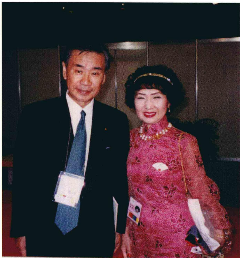
一九九七年香港回归庆典上，日本前首相羽田孜与作者合影。