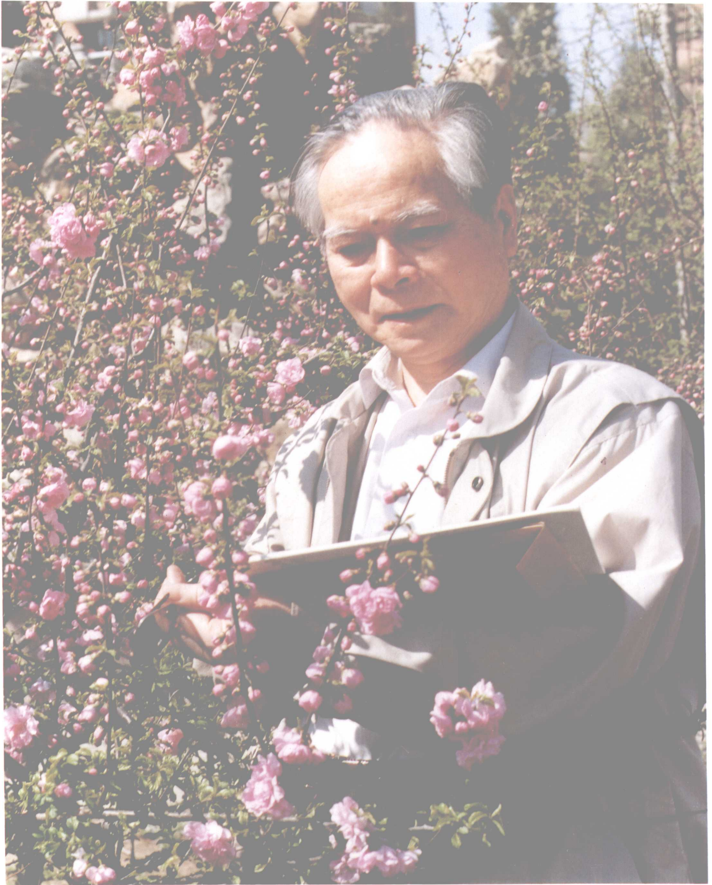
5 关山月自小爱梅、画梅。他“画梅是画梅花的感情、性格和它的意境，通过梅花表现出作者的感情、品性和时代精神”。