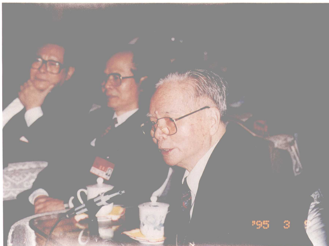
7 1995年，关山月在全国人大会议广东代表团讨论会上发言。