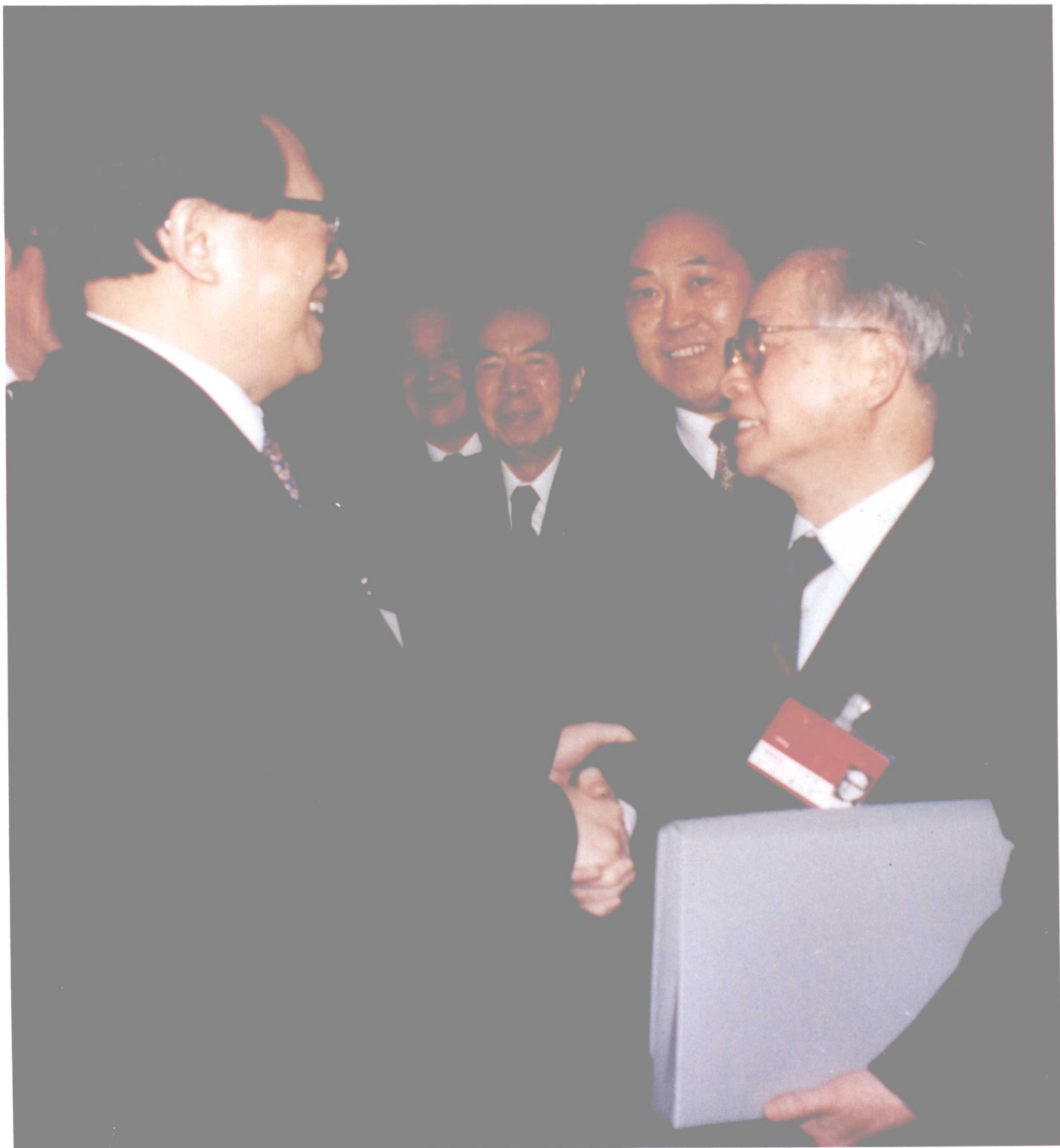
2 1994年3月，关山月参加全国人民代表大会，并受到江泽民总书记的亲切接见。