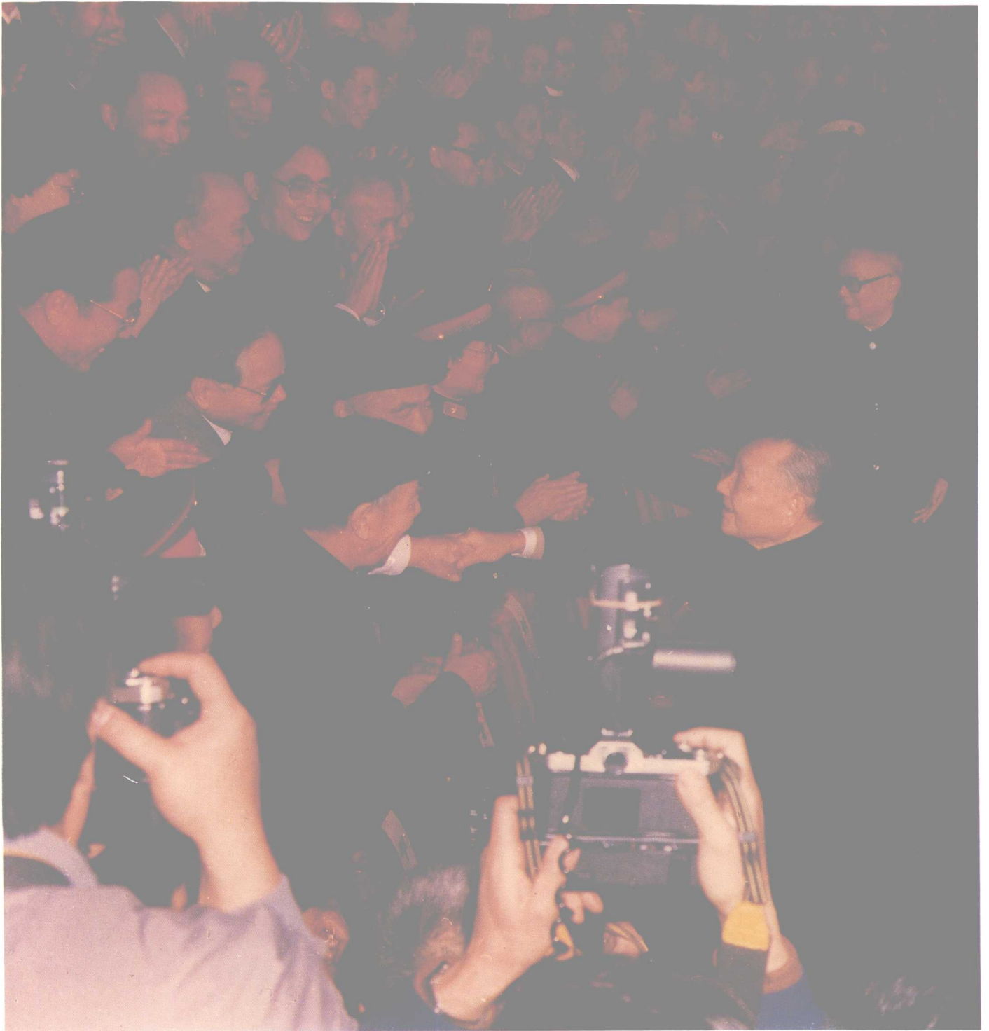
1 1987年11月3日，在中国共产党第十三次全国代表大会上，邓小平和关山月握手。