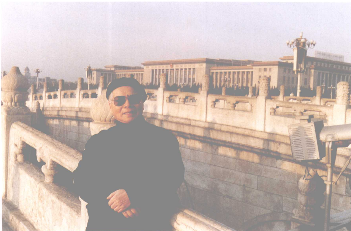
6 在北京天安门金水桥畔。