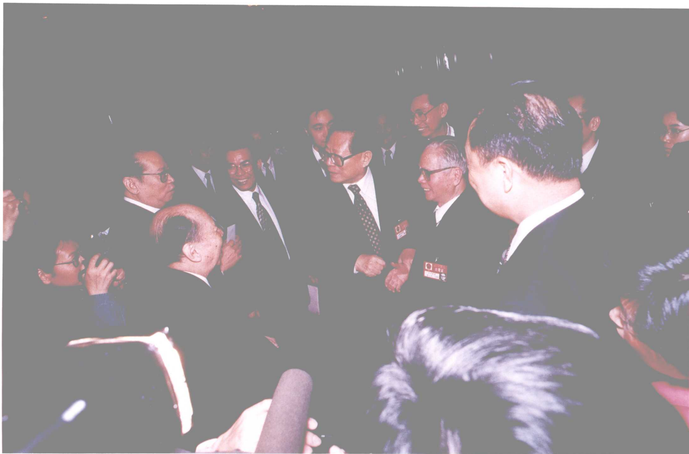
3 1997年3月5日，江泽民总书记与关山月代表在人民大会堂广东厅亲切交谈。