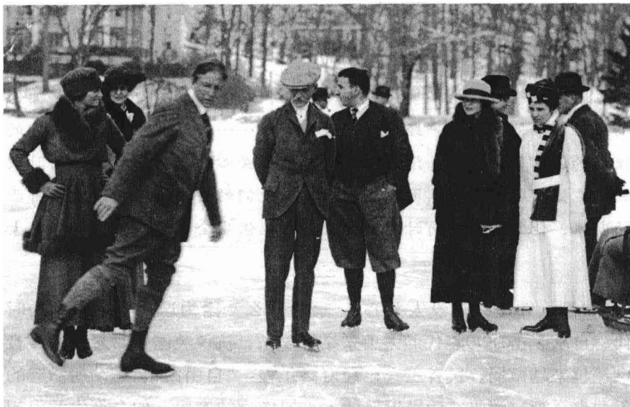
公园里溜冰 的纽约人