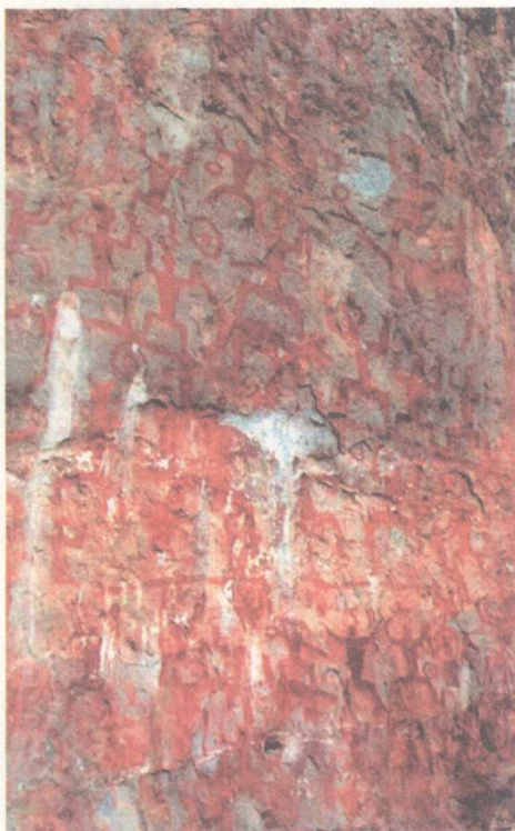
广西左江岸花山崖画

追求美是人类的天性，也是人作为灵长类高等动物区别于其他动物的本质的特征之一。追求美是一种社会现象（人在群体社会中才有美的意识和对美的追求），它的历史可以追溯至人类社会幼年时期。当原始人类还没有发明语言文字的时候，他们就已经有了朦胧的审美意识，有了原始的审美行为。如唱歌跳舞已经成为他们表达情绪与娱乐的方式，在制造工具与表达愿望的过程中萌生了雕塑与绘画的雏形等。在现今发现的原始时期的岩画里，我们可看到许多动物等绘画形象，见到原始人载歌载舞的生动场面。在世界各地原始人居住过的洞窟里，我们也能看到他们遗留下的用来装饰自己的贝壳、兽牙以及石制工具上的装饰花纹等物。由此可见，追求美是世界不同人种祖先都具备的天性。