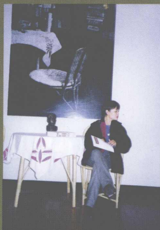
在上海鲁迅纪念馆“内山书店”