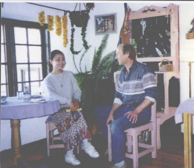
美国，新墨西哥州的小镇，越战老兵替姆家里