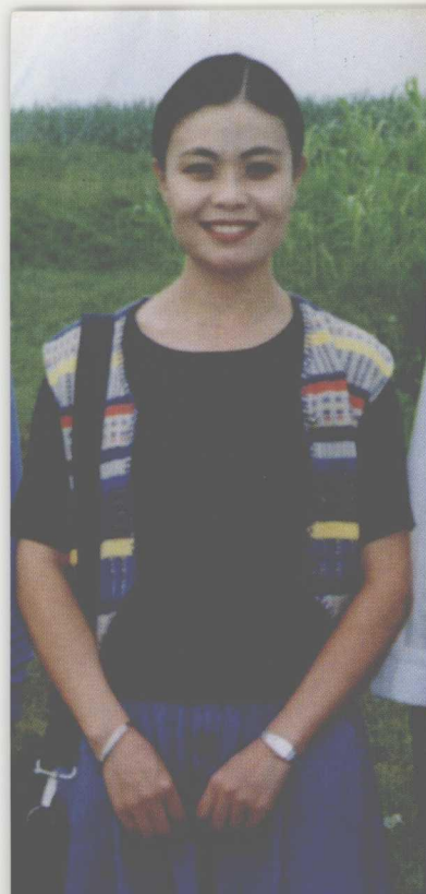
身后的这片土地是我写作《孕妇和牛》的地方