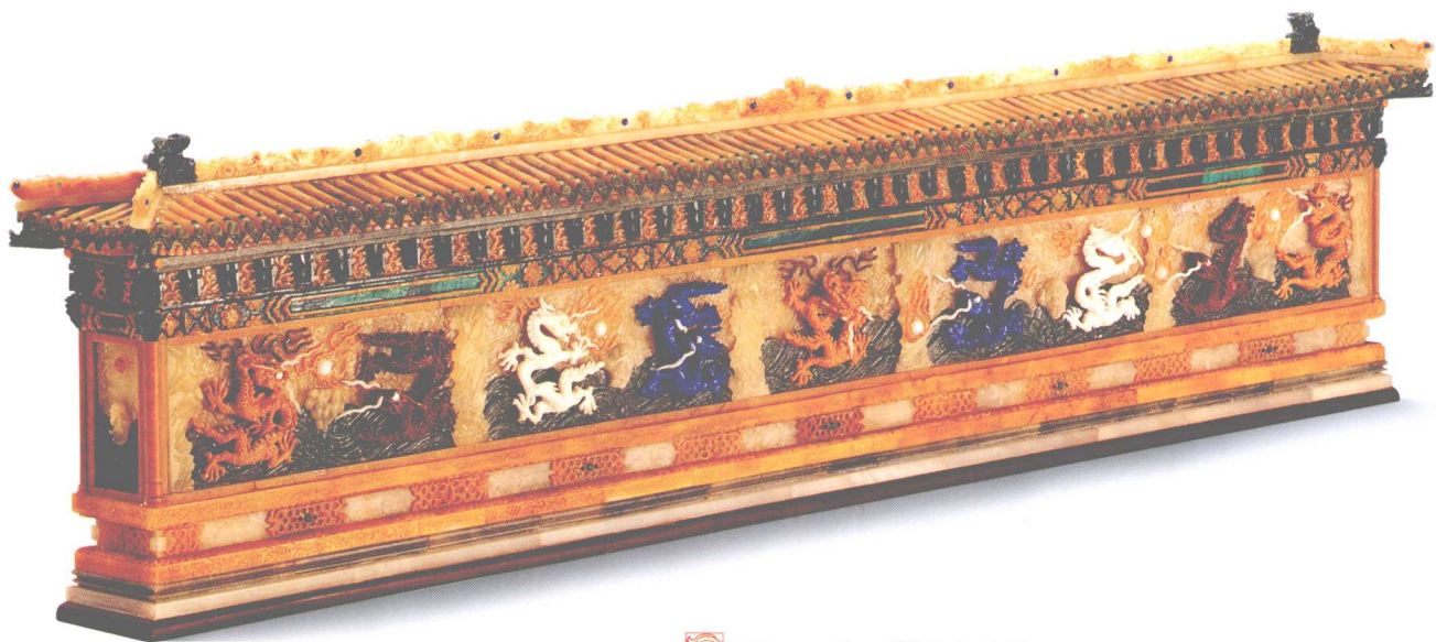
C 名 称：微雕九龙壁 材 质：多种玉石镶嵌 作 者：刘玉钢 规 格：26.5 × 6.5 × 1.2cm 送展单位：天津玉雕协会 奖 项：金奖

作品采用碧玉传统的痕都斯坦工艺雕琢而成，吉祥纹样装饰其中，碗胎匀而薄，纹饰精而美，玉质细而润，两只对碗一模一样，实为难得的艺术珍品。