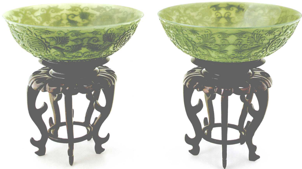
C 名 称：薄胎碗（对） 材 质：碧玉 作 者：高庆国 规 格：16 × 16 × 7cm 送展单位：山东淄博集润堂 奖 项：金奖

作品采用碧玉传统的痕都斯坦工艺雕琢而成，吉祥纹样装饰其中，碗胎匀而薄，纹饰精而美，玉质细而润，两只对碗一模一样，实为难得的艺术珍品。