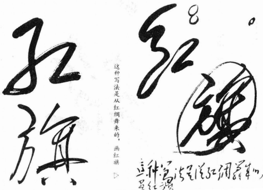
毛泽东同志 1958 年为《红旗》写过多幅刊头，这是其中的四幅。