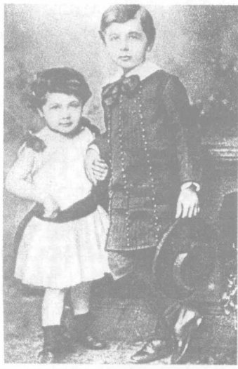
爱因斯坦 5 岁时与妹妹玛雅，1884 年慕尼黑。