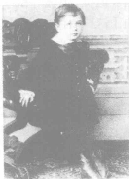
这张照片摄于1883年，当时爱因斯坦将近5岁。就在这一年，母亲带他去上小提琴课。父亲给了他一种叫做指南针的“玩具”。

葆琳给小阿尔伯特请了一位市里著名的小提琴手当家庭教师，每周三次，在家里授课。她自己则亲自教女儿玛雅弹奏钢琴。