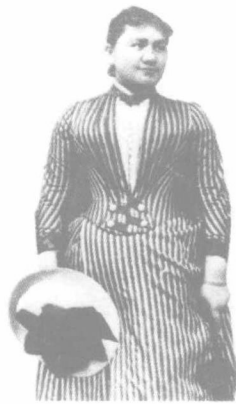
爱因斯坦的母亲葆琳。她强迫爱因斯坦去听小提琴课。一开始他强烈地反对，但随着时间的推移，他便深深地爱上了音乐，并以音乐伴其一生。

喜欢沉思，这已经成为爱因斯坦终生的行为特征和习惯。正是这个习惯，造就了他后来非凡的科学发现。