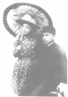
这是1893年的爱因斯坦和妹妹玛雅。在爱因斯坦一生中，玛雅始终都是他和他的理论的追随者。

爱因斯坦到了上学的年龄，按理说他应当和当地绝大多数的犹太人家庭的孩子一样，被送到当地的犹太教教会开办的学校去念书。