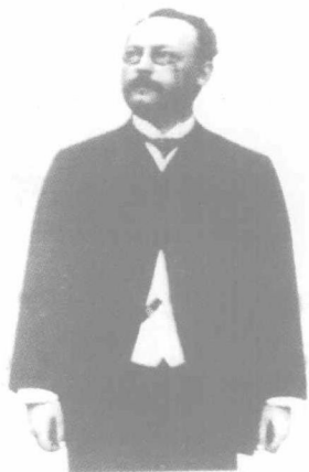
爱因斯坦的父亲赫尔曼，后来又经营电器业务，他没有继承犹太人那种善于经营的本领，业务常常徘徊于失败的边缘。但他却最早使爱因斯坦感受到科学的巨大力量。

赫尔曼利用变卖家产得到的钱财，再加上他们在亲友中间筹集到的所有资金，和弟弟雅可布合伙，在慕尼黑开办了一家安装煤气和自来水管道的企业，不久以后又开办了一家电子技术工厂，制