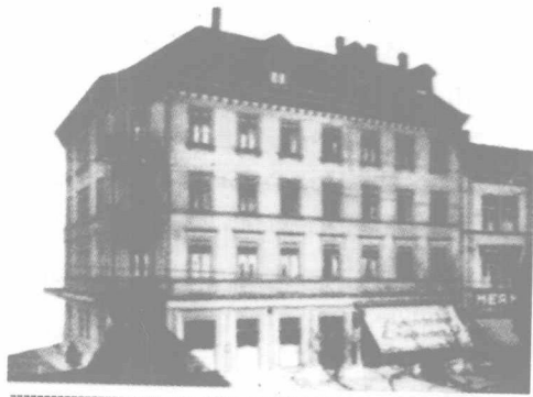
这是赫尔曼·爱因斯坦在乌尔姆的宅第，它庄重典雅，象征着赫尔曼·爱因斯坦事业上曾经的辉煌。1879年阿尔伯特·爱因斯坦就出生在这里。

赫尔曼·爱因斯坦一家是世代都生活在德国的犹太人家庭中的一个。他们和其他生活在德国的犹太人一样，从来就把德国看做是自己的祖国。赫尔曼